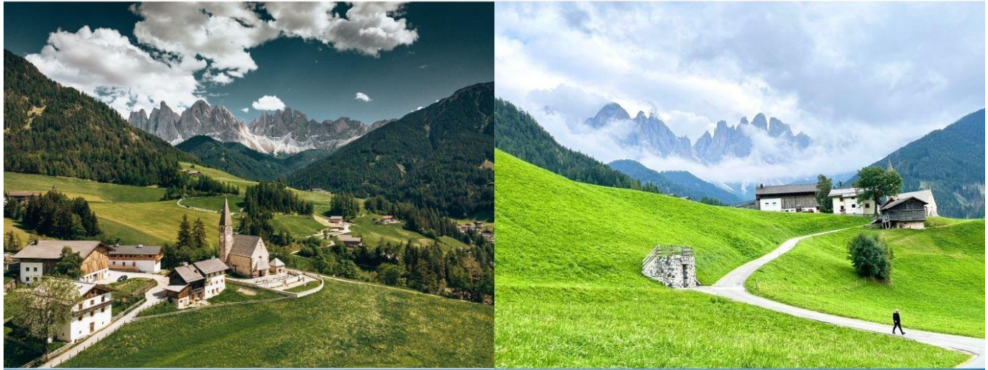
Santa Maddalena - Val di Funes

บริการอาหารกลางวัน ณ ภัตตาคาร จากนั้นนำท่านเดินทางสู่ ชุมชน Val di Funes ชุมชนเล็กๆ ทางภาคตะวันตกของอุทยานโดโลไมต์ ประกอบไปด้วยหมู่บ้านเล็กๆ 6 หมู่บ้าน โดยมีชื่อเสียงจากการมีวิวทิวทัศน์ที่สวยงามที่สุดในเขต South Tyrol อีสาระให้ท่านเก็บภาพความประทับใจ จากนั้นนำท่านเก็บภาพความประทับใจอีกหนึ่งสถานที่ ณ โบสถ์ Santa Maddalena โบสถ์ที่ถือเป็นสถานที่ไฮไลท์ที่ถูกถ่ายรูปมากที่สุดในอุทยานโดโลไมต์ มีวิวทิวทัศน์ที่สวยงามมีฉากหลังเป็นเทือกเขา Odles (การเดินทางขึ้นไปเก็บภาพความประทับใจนี้ ท่านจะต้องเดินขึ้นลงเนินไปและกลับประมาณ 2 กิโลเมตร เพื่อไปเก็บภาพ)