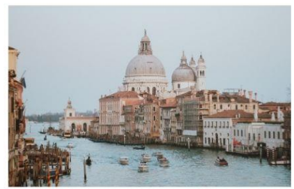
แกรนด์คาแนล

นำทุกท่านนั่งเรือต่อเพื่อไปยัง ท่าเรือซานมาร์โก (San Marco Pier) บนเกาะเวนิส แวะให้ท่านถ่ายรูปสวยๆ เก็บเป็นที่ระลึกกันที่ พระราชวังดอดจ์ พระราชวังริมน้ำแสนอลังการ ที่สร้างตั้งแต่ศตวรรษที่ 14 ในสไตล์เวเนเซียนโกธิค ที่เคยเป็นที่ประทับของผู้ปกครองของเวนิส แต่ตั้งแต่ปี 1923 ก็ได้เปลี่ยนเป็นพิพิธภัณฑ์ให้คนทั่วไปได้เข้าชม เป็นหนึ่งในแลนด์มาร์กหลักของเวนิส จากนั้นเดินเที่ยวชมแลนด์มาร์คสำคัญต่างๆ ในเมือง จัตุรัสเซนต์มาร์ค เป็นจัตุรัสหลักของเมืองเวนิส และยังเป็นศูนย์กลางเมืองตั้งแต่โบราณ จากนั้นนำท่านถ่ายรูปกับ มหาวิหารเซนต์มาร์ค มหาวิหารใหญ่ ของศาสนาคริสต์นิกายโรมันคาทอลิก อลังการด้วยการตกแต่งด้วยโดมใหญ่ และที่อยู่ติดกันและโดดเด่นด้วยความสูงถึง 50 เมตรก็คือ หอรบั้ง ถือเป็นหนึ่งในสัญลักษณ์ของเมืองที่ เห็นได้ไม่ว่าจะอยู่มุมไหนของเมืองก็ตาม และที่พลาดไม่ได้เลยก็คือ สะพานถอนหายใจ สะพานอันโด่งดังแห่งนี้ตั้งอยู่เหนือแม่น้ำที่คั่นกลางระหว่างคุกเก่ากับพระราชวังดอดจ์