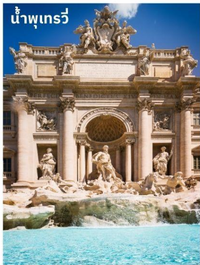
น้ำพุเทรวิ

จากนั้นนำท่านถ่ายรูปด้านหน้าของ สนามกีฬาโคลอสเซียม (Colosseum) เป็น 1 ใน 7 สิ่งมหัศจรรย์ของโลกยุคโบราณ ในอดีตนั้นเป็นสนามประลองการต่อสู้ที่ยิ่งใหญ่ของชาวโรมันที่สามารถจุผู้ชมได้ถึง 50,000 คน จากนั้นนำท่านชมงานประติมากรรมของเทพนิยายกรีกและโยนเหรียญลูอิซฐานบริเวณ น้ำพุเทรวิ (Trevi Fountain) สัญลักษณ์ของกรุงโรมที่โด่งดัง จากนั้นอิสระตามอัธยาศัยกับการเลือกซื้อสินค้าแฟชั่นและของที่ระลึกในบริเวณย่าน บันไดสเปน (The Spanish Step) ซึ่งเป็นแหล่งแฟชั่นชั้นนำสุดหรูและยังเป็นแหล่งนัดพบของชาวอิตาลี