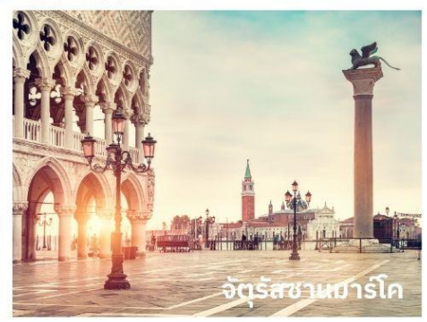
จัตุรัสซานมาร์โก

ท่านสามารถทำการสแกน QR CODE นี้ เพื่อรับชม เกาะเวนิส ในรูปแบบวิดีโอ