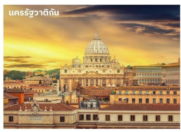
นครรัฐวาติกัน

ประเทศที่เล็กที่สุดในโลกตั้งอยู่ใจกลางกรุงโรม เป็นประเทศเดียวในโลกที่มีกำแพงล้อมรอบเมืองเอาไว้ได้ทั้งหมด ยกเว้นด้านหน้าทางเข้า และเป็นศูนย์กลางของศาสนาคริสต์นิกายโรมันคาทอลิก โดยมีพระสันตะปาปา มีอำนาจปกครองสูงสุด นำท่านชมมหาวิหารที่ใหญ่ที่สุดในโลก มหาวิหารเซนต์ปีเตอร์ (St.Peter's Basilica)