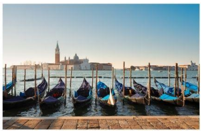
เรือกอนโดลา

นำท่านออกเดินทางสู่ ท่าเรือตรอนเคโตโต้ เพื่อเตรียมตัวนั่งเรือข้ามสู่เกาะเวนิส เกาะเวนิสเป็นดินแดนแสนโรแมนติก เป็นเมืองที่ไม่เหมือนใคร โดยใช้เรือแทนรถ ใช้คลองแทนถนน มีสมญานามว่าเป็น “ราชินีแห่งทะเลเอเดรียติก” มีเกาะน้อยใหญ่กว่า 118 เกาะและมีสะพานเชื่อมถึงกัน กว่า 400 แห่ง