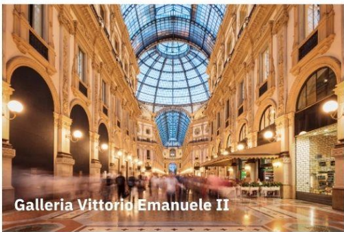
Galleria Vittorio Emanuele II

อิสระช้อปปิ้ง ที่ Galleria Vittorio Emanuele II ที่ตั้งอยู่ทางฝั่งขวาของมหาวิหารมิลาน เป็นห้างสรรพสินค้าที่เก่าแก่ที่สุดในอิตาลี โดยสร้างขึ้นในปี 1877 มากมายด้วยร้านค้า ร้านอาหาร จุดเด่นของอาคารก็คือหลังคาทรงโดมเป็นกระจกใส ทำให้สามารถช้อปปิ้งได้ในทุกสภาพอากาศ