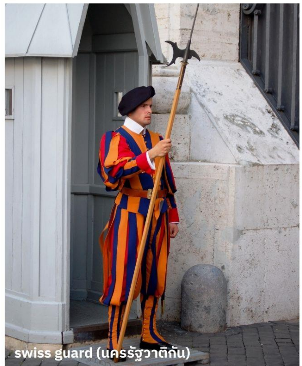
swiss guard (นครรัฐวาติกัน)