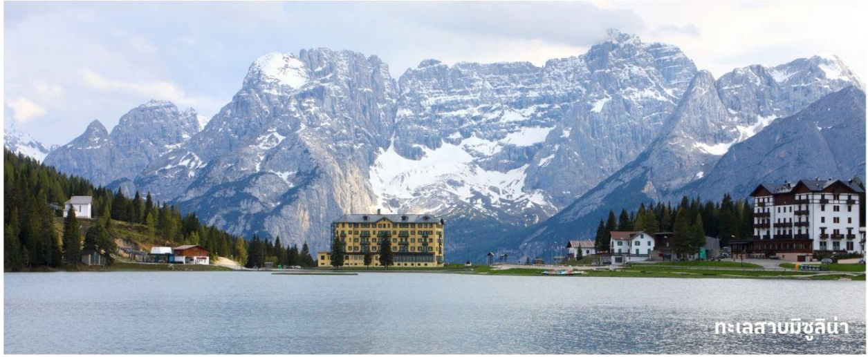
ทะเลสาบมิซูลีน่า