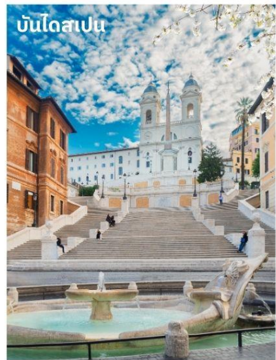
บันไดสเปน

ค่า บริการอาหารค่ำ ณ ภัตตาคาร นำท่านเข้าสู่ที่พัก IH Hotel Roma Z3 หรือเทียบเท่า