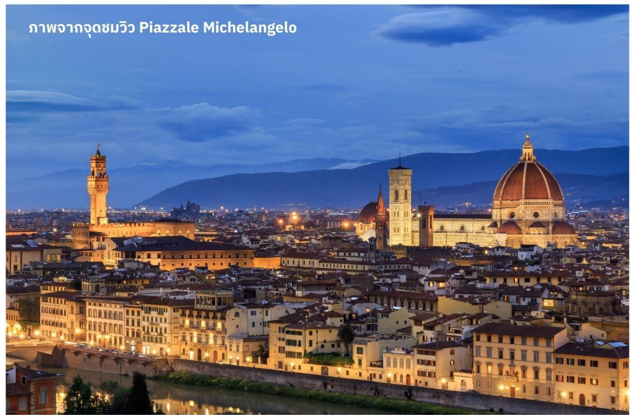
ภาพจากจุดชมวิว Piazzale Michelangelo

เมืองฟลอเรนซ์ ตั้งอยู่ทางตอนเหนือของประเทศอิตาลี เป็นเมืองที่มีชื่อเสียงในช่วงศตวรรษที่ 13-14 ซึ่งเป็นยุคที่เจริญรุ่งเรืองของวัฒนธรรมและศิลปะ อีกทั้งในอดีตยังมีความสำคัญทางการค้าและวัฒนธรรม มีสถาปัตยกรรมทั้งงดงามและเป็นที่มาของศิลปะโรแมนติกที่เจริญรุ่งเรืองอย่างมากในยุคนั้น นำท่านเดินทางไปยังเนินเขา Piazzale Michelangelo เพื่อชมวิวของเมือง Florence ที่นักท่องเที่ยวรวมไปถึงชาว Florence เอง มักขึ้นมาชมบรรยากาศในมุมสูงของเมือง ซึ่งจะเห็นหลังคาสีแดงของอาคารบ้านเรือนต่างๆ รวมไปถึง Duomo เรียงรายกันเป็นแนวสวยงามยิ่งนัก อิสระให้ท่านเก็บภาพประทับใจตามอัธยาศัย