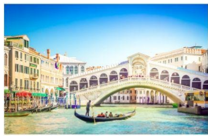
สะพานริอัลโต