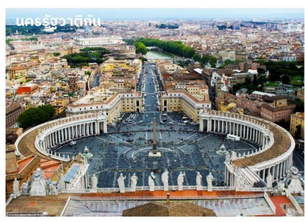
นครรัฐวาติกัน