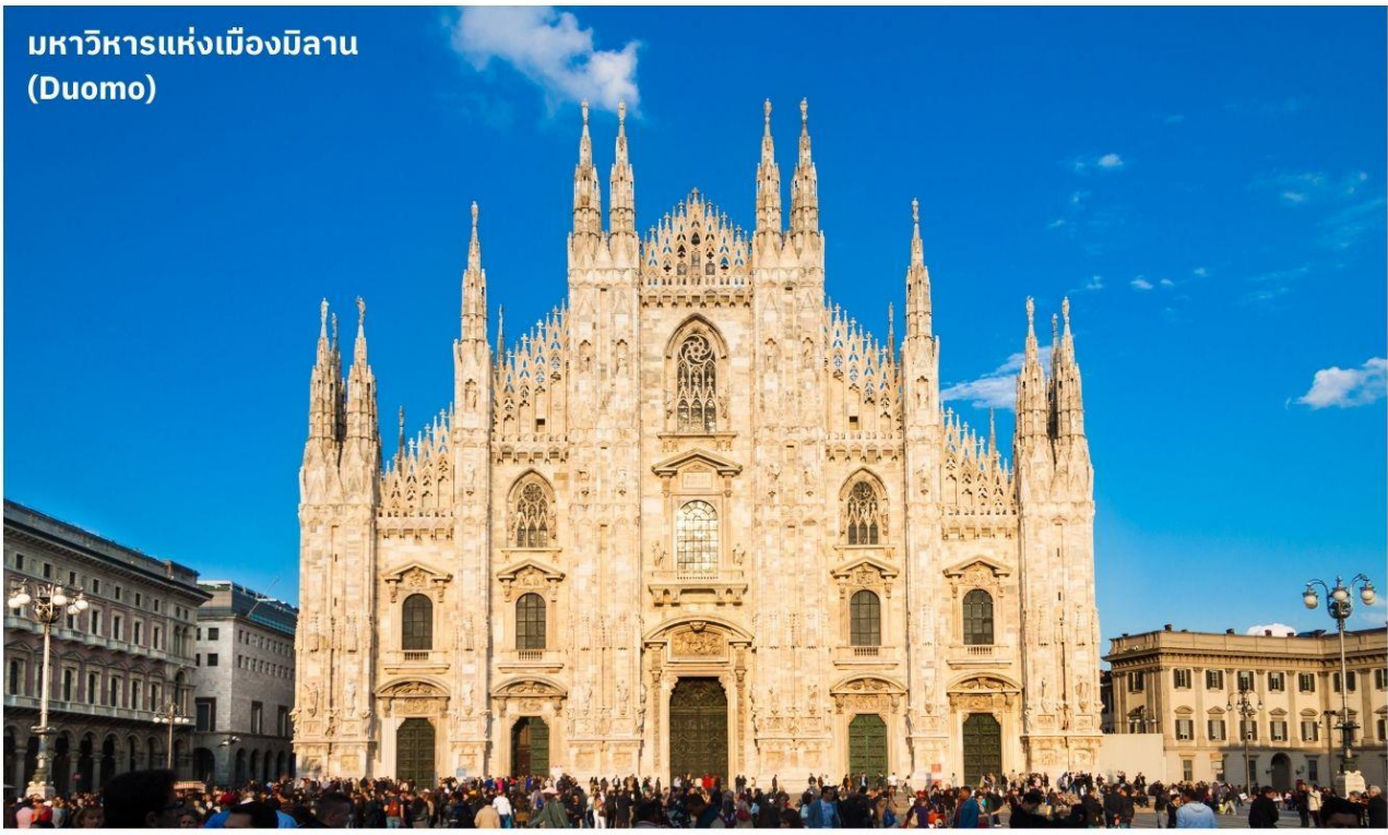
มหาวิหารแห่งเมืองมิลาน (Duomo)

นำท่านถ่ายรูปกับ มหาวิหารมิลาน (Milan Duomo) มหาวิหารประจำเมืองขนาดใหญ่แห่งนี้คือโบสถ์ที่ใหญ่ที่สุดในประเทศอิตาลีเด่นด้วยศิลปะแบบโกธิค ใช้เวลาในการก่อสร้างทั้งสิ้น 579 ปี ตั้งอยู่ในระดับความสูง 108.5 เมตรจากพื้นดินรายล้อมด้วยยอดแหลมอีก 135 ยอดทำให้อาสนวิหารดูสง่าและแปลกพร้อมด้วยรูปแกะสลักจากหินอ่อนที่ประดับอยู่โดยรอบสลักอย่างวิจิตรบรรจงด้วยรูปปั้นนักบุญรูปเรื่องราวในพระคัมภีร์จำนวนมากประดับโดยรอบ