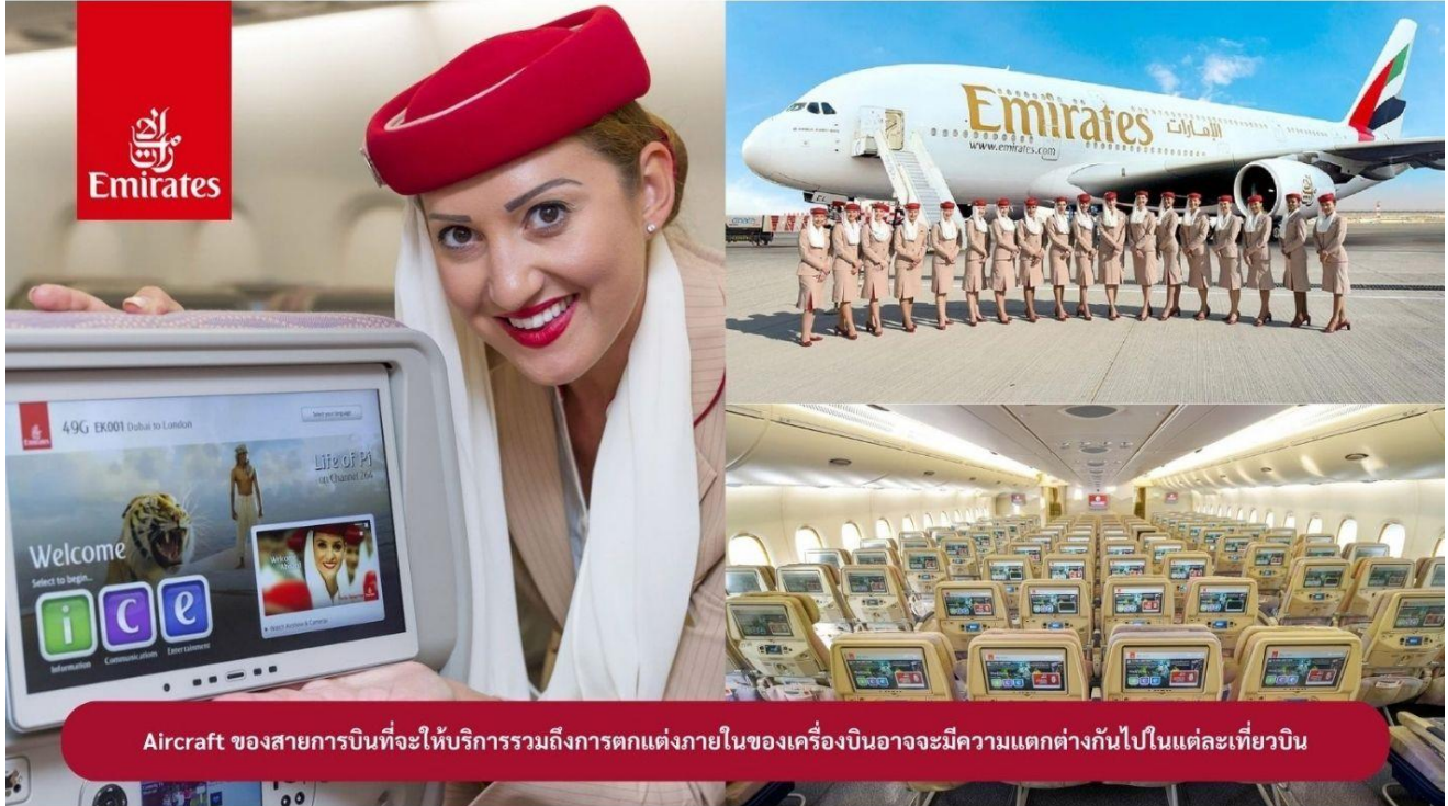
Aircraft ของสายการบินที่จะให้บริการรวมถึงการตกแต่งภายในของเครื่องบินอาจจะมีความแตกต่างกันไปในแต่ละเที่ยวบิน