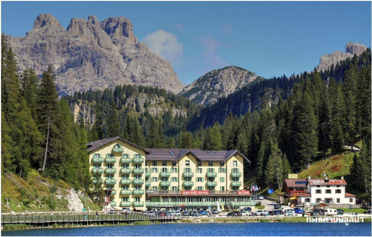
ทะเลสาบมิซูลีน่า

นำทุกท่านเดินทางสู่ เมืองคอร์ติน่า ดอมปาสโซ (Cortina d'Ampezzo) ใช้เวลาเดินทางประมาณ 40 นาที เป็นเมืองสกีรีสอร์ทที่อยู่ในอุทยานแห่งชาติเทือกเขาโดโลไมท์ (DOLOMITE) คอร์ติน่าดอมปาสโซนั้นสกีรีสอร์ท BEST OF THE ALPS เพียงแห่งเดียวของอิตาลีที่ได้รับการยกย่องให้เป็น 1 ใน 10 สกีรีสอร์ทที่ดีที่สุดในโลก เคยใช้เป็นสถานที่จัดการแข่งขันกีฬาโอลิมปิกฤดูหนาวในปี 1956 (เมืองคอร์ติน่า ดอมปาสโซ เป็นเมืองที่ใช้ในการพักค้างคืนเท่านั้น อาจจะมีการเปลี่ยนแปลงได้หากไม่มีที่พักว่างในช่วงวันเดินทางนั้นๆ โดยทางบริษัทจะเปลี่ยนไปยังเมืองอื่นแทนโดยยังคงซึ่งความสะดวกสบายในการเดินทาง)