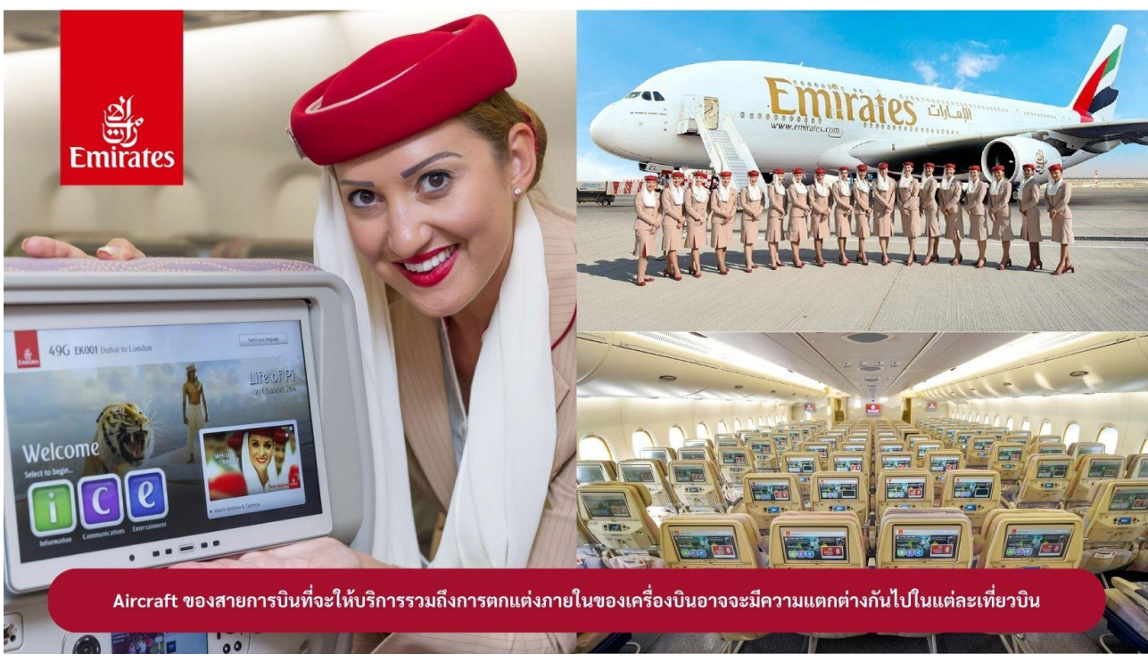
Aircraft ของสายการบินที่จะให้บริการรวมถึงการตกแต่งภายในของเครื่องบินอาจจะมีความแตกต่างกันไปในแต่ละเที่ยวบิน

18.00 น. ✈️ คณะเดินทางพร้อมกัน ณ สนามบินสุวรรณภูมิ อาคารผู้โดยสารขาออกระหว่างประเทศ ชั้น 4 ประตู 9 แถว T สายการบินเอมิเรสต์ แอร์ไลน์ (EK) เจ้าหน้าที่ให้การต้อนรับและอำนวยความสะดวก 21.05 น. ✈️ ออกเดินทางสู่ เมืองดูไบ ประเทศสหรัฐอาหรับเอมิเรสต์ โดยสายการบินเอมิเรสต์ เที่ยวบินที่ EK373 (📺 บริการอาหารและเครื่องดื่มบนเครื่องบิน)