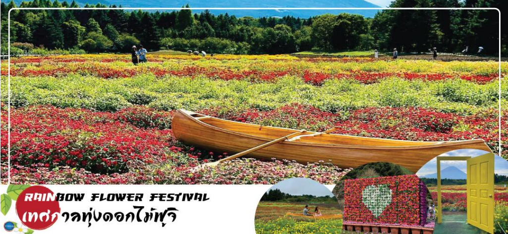
RAINBOW FLOWER FESTIVAL เทศกาลทุ่งดอกไม้ฟูจิ

หรือ ชม Rainbow Flower Festival 2025 (ปกติเทศกาลจะจัดช่วง ปลายเดือนสิงหาคม - ต้นเดือนตุลาคม ซึ่งกำหนดการปีนี้นี้ยังไม่มีการประกาศอย่างเป็นทางการ) สถานที่จัดงานบริเวณควากุจิโกะ เมืองแห่งภูเขาไฟฟูจิ เทศกาลดอกไม้เมืองร้อนที่มีชื่อเสียงของญี่ปุ่น ที่มีเพียงปีละครั้งเท่านั้น ภายในเทศกาลมีการจัดแสดงดอกไม้เมืองร้อนหลากหลายกว่า 10 ชนิด ไม่ว่าจะเป็น ดอกมิโกเนีย, ดอกชินเนีย, ดอกซัลเวีย และดอกรัตเมเกีย นอกจากนี้ยังสามารถมองเห็นวิวของภูเขาไฟฟูจิได้อีกด้วย ภายในสวนมีจุดให้ถ่ายรูปมากมาย และยังมีสวนดอกไม้สไตล์อังกฤษที่มาพร้อมตัวละครมาสคอตสุดน่ารัก "Piter Rabbit English Gardent" และนอกจากนี้ยังมีคาเฟ่ไวน์นั่งพักผ่อนชมวิวแบบชิลๆอีกด้วย