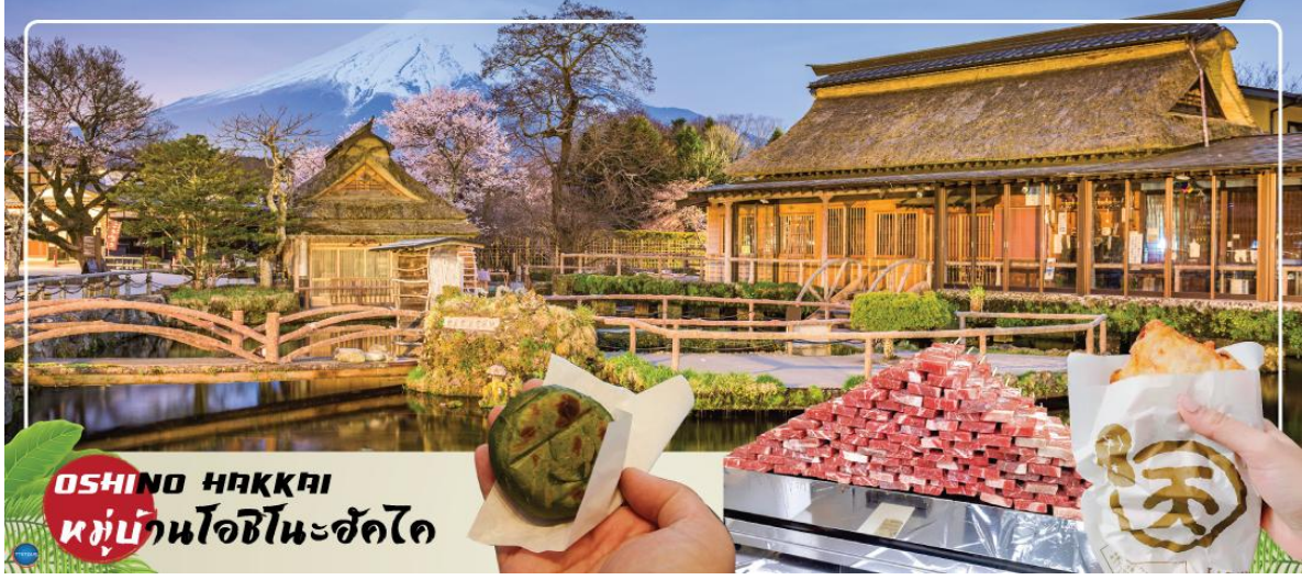
OSHINO HAKKAI หมู่บ้านโอชิโนะฮักไก

ได้เวลาอันสมควรนำท่านเดินทางสู่ หมู่บ้านโอชิโนะฮักไก (Oshino Hakkai) ให้ท่านเจาะลึกตามหาแหล่งน้ำบริสุทธิ์จากภูเขาไฟฟูจิ ที่เป็นแหล่งน้ำตามธรรมชาติตั้งอยู่ในหมู่บ้านโอชิโนะ จ.ยามานาชิ หรือพูดในทางกลับกันคือกลุ่มน้ำผุดโอชิโนะฮักไก เพียงก้าวแรกที่ย่างเท้าเข้าไปในหมู่บ้านก็สัมผัสได้ถึงอากาศบริสุทธิ์ และไอเย็นจากแหล่งน้ำธรรมชาติที่มีให้เห็นอยู่ทุกมุม โดยในบ่อน้ำใสแจ๋วมีปลาหลากหลายพันธุ์แหวกว่ายอย่างสบายอารมณ์ แต่ขอบอกเลยว่าน้ำแต่ละบ่อนั้นเย็นจับใจจนแอบสงสัยว่าน้องปลาไม่หนาวสะท้านกันบ้างหรือ เพราะอุณหภูมิในน้ำเฉลี่ยอยู่ที่ 10-12 องศาเซลเซียสนอกจากชมแล้วก็ยังมีน้ำผุดจากธรรมชาติให้ดื่มตามอัธยาศัย และที่สำคัญ หมู่บ้านโอชิโนะยังเป็นแหล่งช้อปปิ้งสินค้าโอท็อปชั้นเยี่ยมอีกด้วย