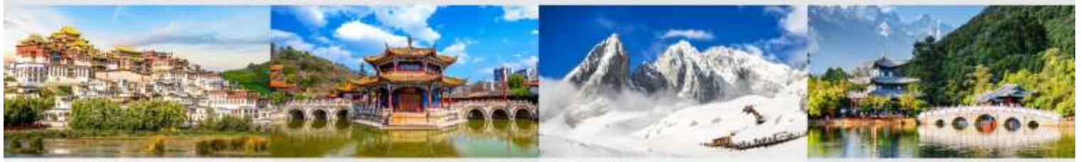
วัดลามะชงจ้านหลิน