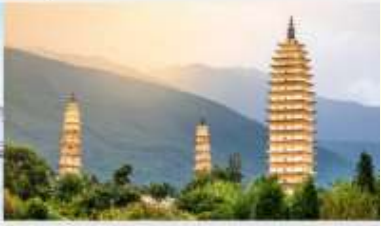
ระเบียงธารน้ำขาว "ไป๋สุ่ยโต"