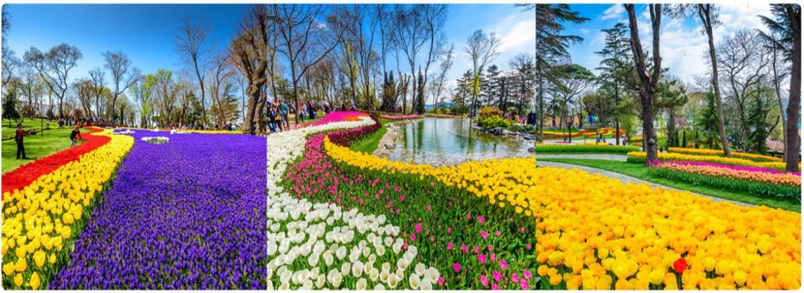
*ภาพเพื่อการโฆษณาเท่านั้น

นำทุกท่านเข้าชม สวนดอกทิวลิป (เทศกาลดอกทิวลิปเปิดให้เข้าชมระหว่างวันที่ 1-30 เมษายนเท่านั้น) สวนดอกทิวลิปหลากสีหลายสายพันธุ์นับล้านดอกที่สวยงามที่สุด และมีชื่อเสียงที่สุดของตุรกี ตลอดเดือนเมษายน เทศกาลทิวลิปอิสตันบูล เป็นเทศกาลประจำปี โดยจะจัดในช่วง 3 สัปดาห์สุดท้ายของเดือนเมษายน เพื่อเฉลิมฉลองทั้งฤดูใบไม้ผลิ และความสำคัญของดอกทิวลิป ที่มีต่ออาณาจักรออตโตมัน และวัฒนธรรมตุรกี ปกติแล้วเทศกาลนี้จัดขึ้นที่สวนสาธารณะ ที่มีชื่อเสียงที่สุดของเมือง ให้ทุกท่านได้ถ่ายรูปตามอัธยาศัย