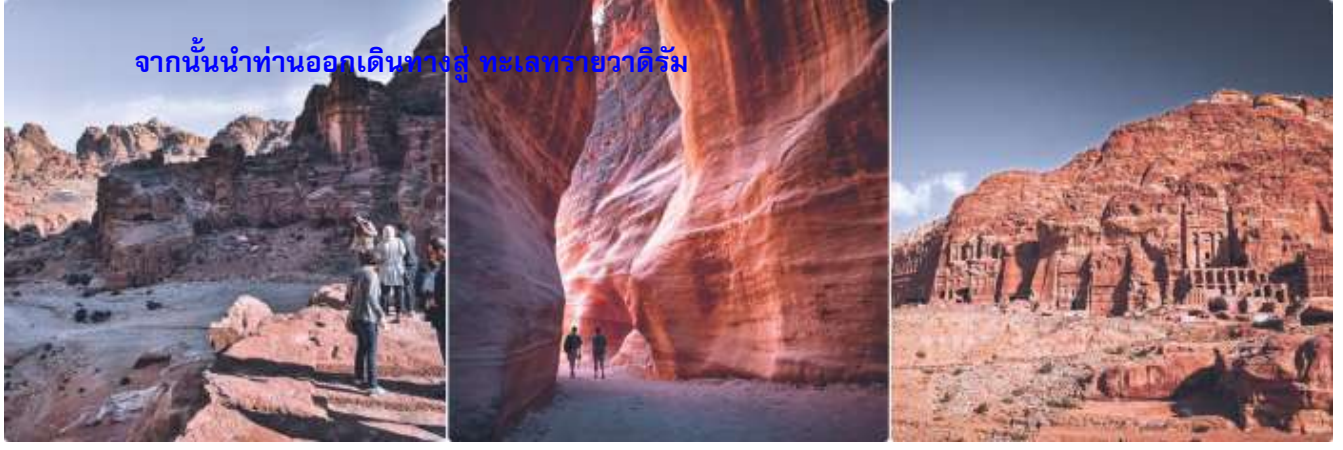
จากนั้นนำท่านออกเดินทางสู่ ทะเลทรายวาดีรัม

ค่าที่พัก รับประทานอาหารค่ำ ณ แคมป์ที่พัก LUXURY RUM MAGIC CAMP (BUBBLE TENT) หรือเทียบเท่า