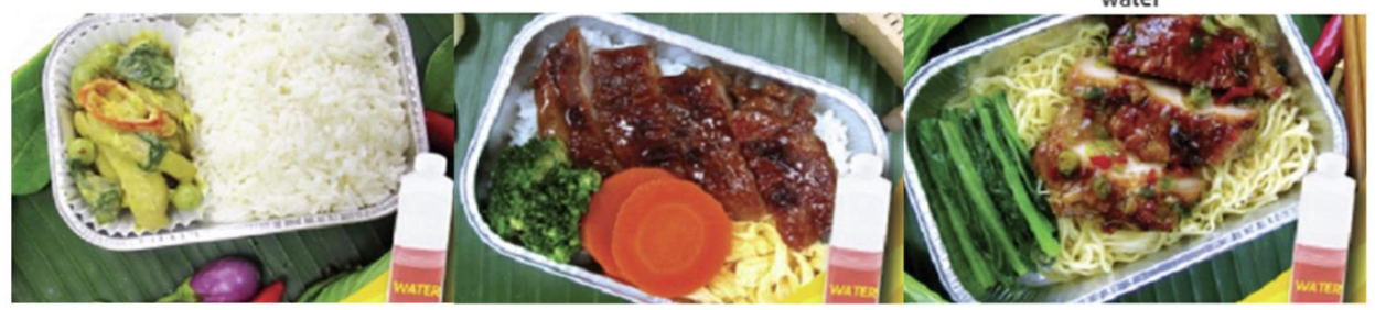
Green curry chicken with rice and water Chicken teriyaki with rice and water Chicken roasted with herb and noodle and water

*** เมนูอาหารอาจมีการเปลี่ยนแปลง ทั้งนี้ขึ้นอยู่กับเที่ยวบิน ***