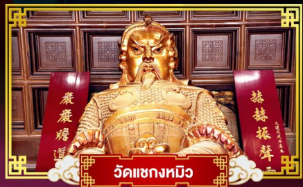
วัดเขกทมิ้ว