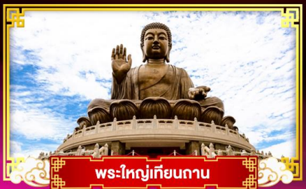
พระใหญ่เทียนถาน

เที่ยว..สวนสนุกดิสนีย์แลนด์ นั่งรถรางพิกแตรม ขึ้นกระเช้ามองปิง 360 องศา