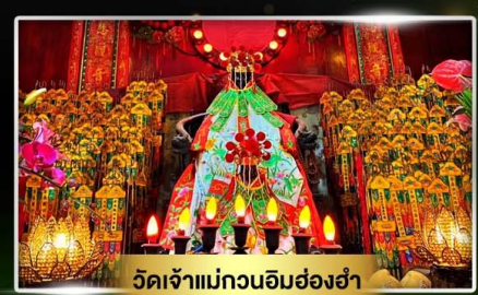
วัดเจ้าแม่กวนอิมอ่อ่งอ้า