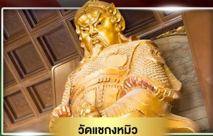
วัดแขกหมิว

หมูนกัณฑ์นำโชควัดแขก ขี้มั่วใน "เจ้ากวณโถม่อ่งอ้า"