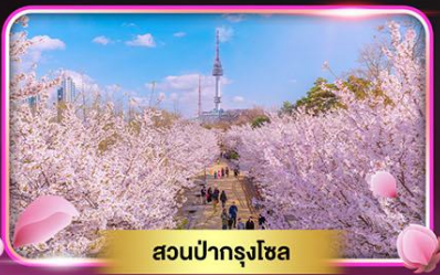
สวนป่ากรุงโซล