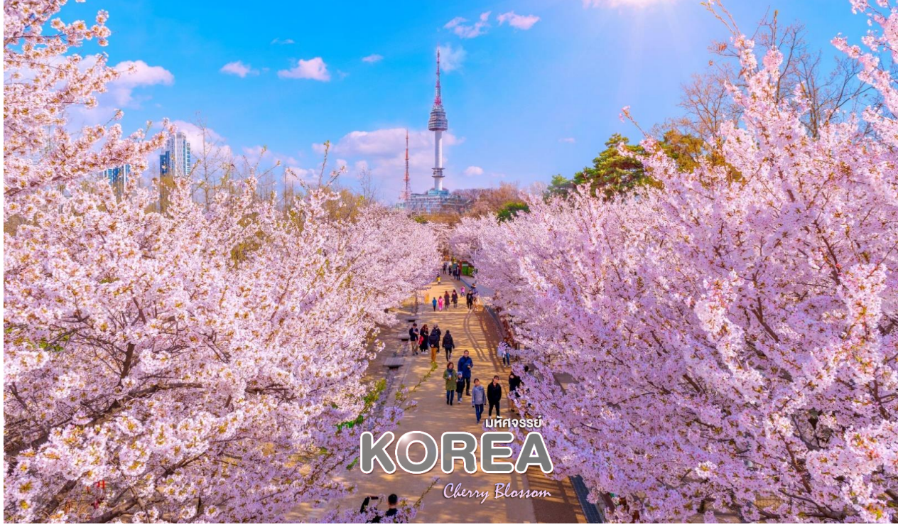
หมายเหตุ : เทศกาลดอกซากุระ SEOUL FOREST เป็นโปรแกรมพิเศษที่พาไปในช่วงดอกซากุระบานเท่านั้น หากดอกซากุระไม่บานหรือหมดช่วงเทศกาล บริษัทฯ ขอสงวนสิทธิ์ปรับโปรแกรมทดแทน “หมู่บ้านโบราณอีกซอนดง”

เป็นสถานที่ท่องเที่ยวยอดนิยมในแถบฤดูกาล ในฤดูใบไม้ผลิต้นซากุระที่ปลูกเรียงรายอยู่ในภายในสวนจะออกดอกบานพริ้งเต็มทุกพื้นที่ นอกจากนี้ ยังมีสิ่งที่น่าสนใจอื่นๆ ให้ชมมากมาย อาทิ สวนผีเสื้อและแมลง มีผีเสื้อและแมลงหลากหลายชนิดให้ได้ชมอย่างใกล้ชิด และยังสามารถพักผ่อนริมทะเลสาบและดื่มด่ำกับวิวทิวทัศน์ได้