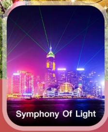
Symphony Of Light

✈️ คอนเฟิร์มออกเดินทาง ✈️ ทุกพีเรียด 2 ท่านขึ้นไป