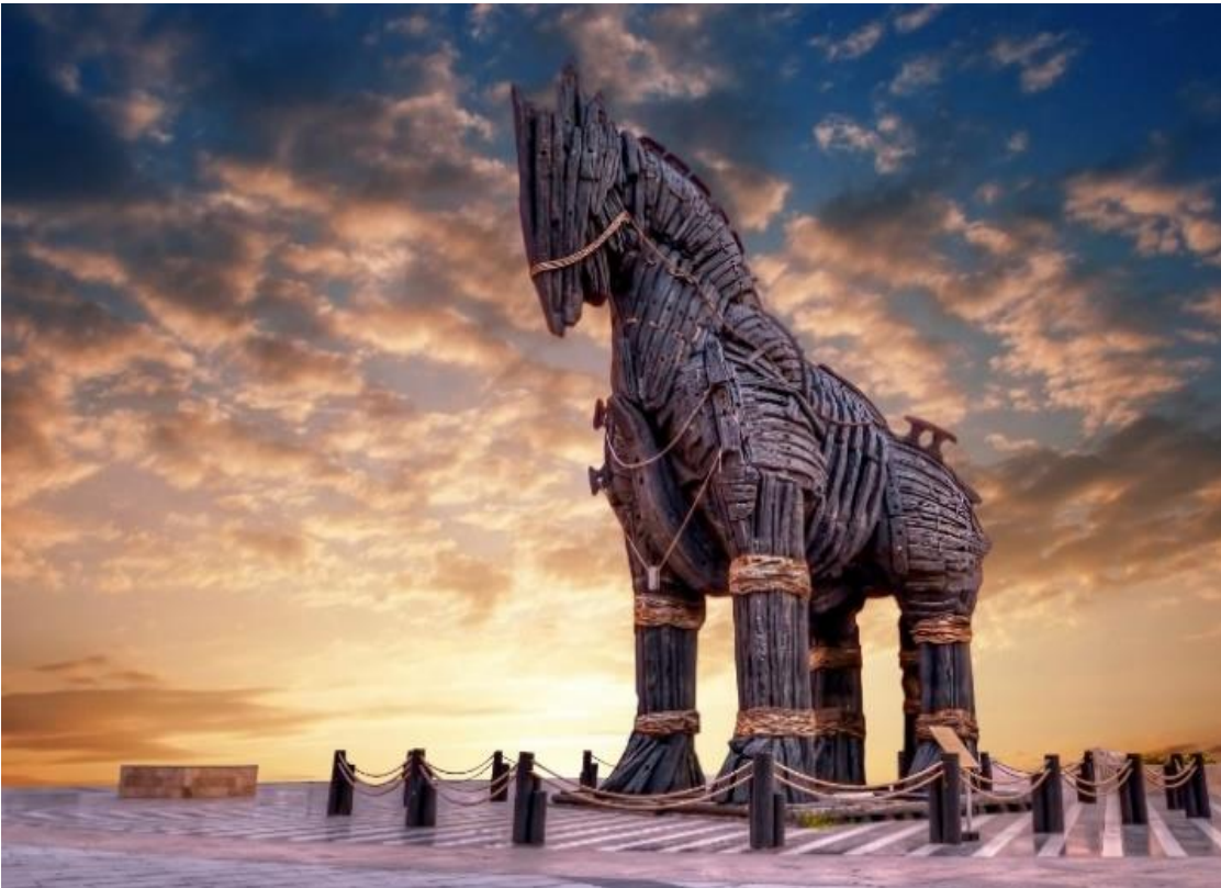
นำท่านชมและถ่ายภาพ ม้าไม้จำลองเมืองทรอยริมทะเล (TROJAN STATUE/HOLLYWOOD HORSE) เป็นม้าไม้ที่มีชื่อเสียงโด่งดังมากที่สุดจากมหากาพย์ภาพยนตร์ฮอลลีวูดเรื่อง ทรอย (Troy) ในปี 2004 มีแบรด