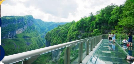
ระเบียงกระจกอุโมงค์