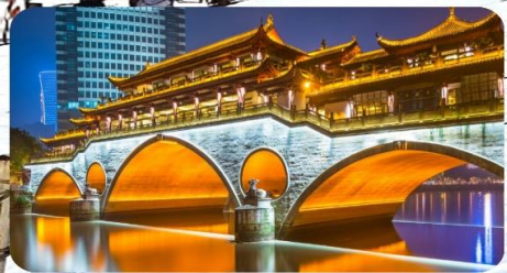
เมืองโบราณตูเจียงเยี่ยน