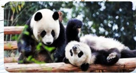
ศูนย์วิจัยหมีแพนด้า