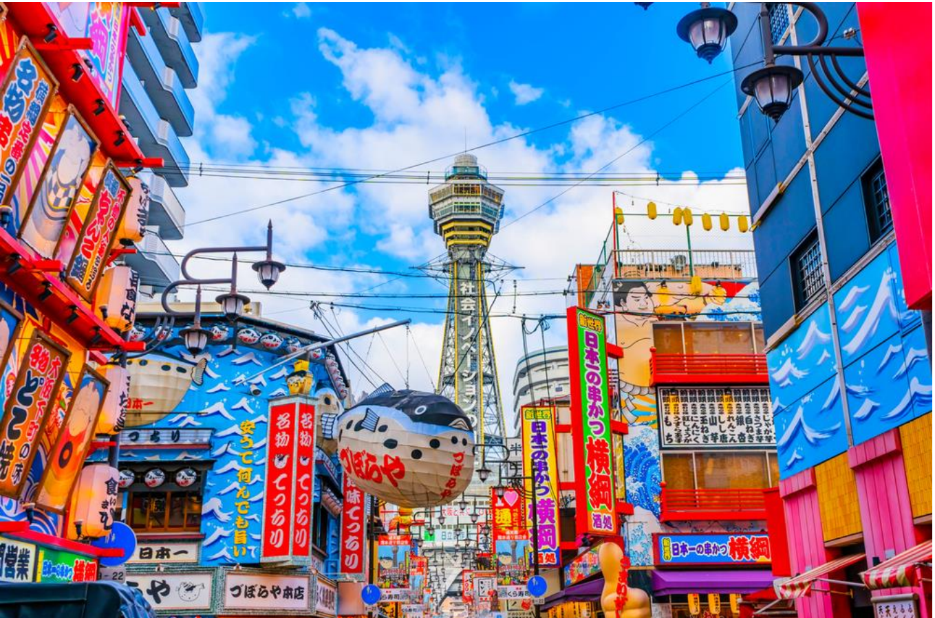
คำ อีสรอาหารตามอัธยาศัยเพื่อสะดวกแก่การท่องเที่ยว ที่พัก WELINA HOTEL PREMIER ,OSAKA หรือเทียบเท่า