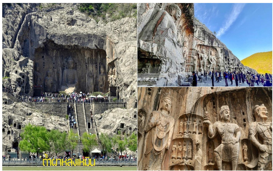
ถ้ำผาลงเหมิน

2,345 ช่อง ศิลาจารึกสลักอักษรจีน และหมายเหตุบันทึกต่างๆ อีก 3,600 กว่าหลัก รวมถึงเจดีย์พุทธ 50 กว่าแห่ง พระพุทธรูปสลักมากกว่า 100,000 องค์ใหญ่สูงสุด 17 เมตร องค์เล็กสุดเพียงแค่ 2 เซนติเมตร