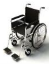
การรับบริการดูแลเป็นพิเศษ

กรณีผู้เดินทางต้องการความช่วยเหลือเป็นพิเศษ อาทิเช่น การใช้วีลแชร์ กรุณาแจ้งบริษัทฯ อย่างน้อย 7 วันก่อนการเดินทาง มิฉะนั้นบริษัทฯ จะไม่สามารถจัดการล่วงหน้าได้ เนื่องจากการใช้วีลแชร์ในสนาม บินนั้น ต้องมีขั้นตอนในการทวงล้อหน้า และบางสายการบินอาจมีการเรียกเก็บค่าใช้จ่ายทั้งทางสนามบิน ในไทยและในต่างประเทศ ซึ่งผู้เดินทางสามารถสอบถามกับเจ้าหน้าที่ได้โดยตรงก่อนทำการจอง และหากใน คณะของท่านมีผู้ต้องการดูแลพิเศษ เช่น ผู้ที่นั่งรถเข็น (Wheelchair), เด็ก, ผู้สูงอายุและผู้ที่มีโรคประจำตัว หรือไม่สะดวกในการเดินทางท่องเที่ยวในระยะเวลานานกว่า 4 - 5 ชั่วโมงติดต่อกัน ท่านและครอบครัวต้อง ให้การดูแลสมาชิกภายในครอบครัวของตนเอง เนื่องจากการเดินทางเป็นหมู่คณะ หัวหน้าทัวร์มีความ จำเป็นต้องดูแลคณะทัวร์ทั้งหมด