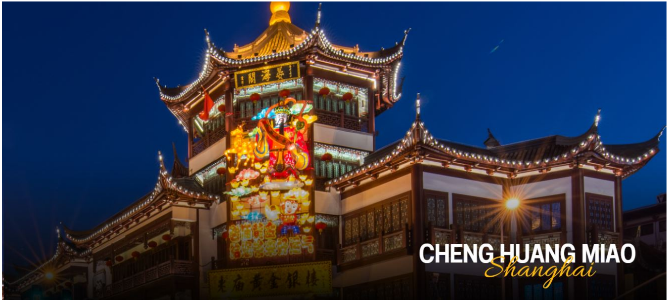
CHENG HUANG MIAO Shanghai