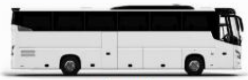
ตัวอย่างรถทัวร์ 1 คัน

ค่าที่พักตามที่ระบุในรายการหรือเทียบเท่าระดับเดียวกัน (พักห้องละ 2 ท่าน) หากประเภทห้องพักที่ท่านสะดวกมากกว่า เช่น 3 เตียงสองฟูกเป็น TWIN BED หรือ DOUBLE BED ทางบริษัทขอสงวนสิทธิ์ในการปรับเปลี่ยนประเภทห้องพัก เป็นตามที่โรงแรมมีอยู่ โดยไม่ต้องแจ้งให้ทราบล่วงหน้า