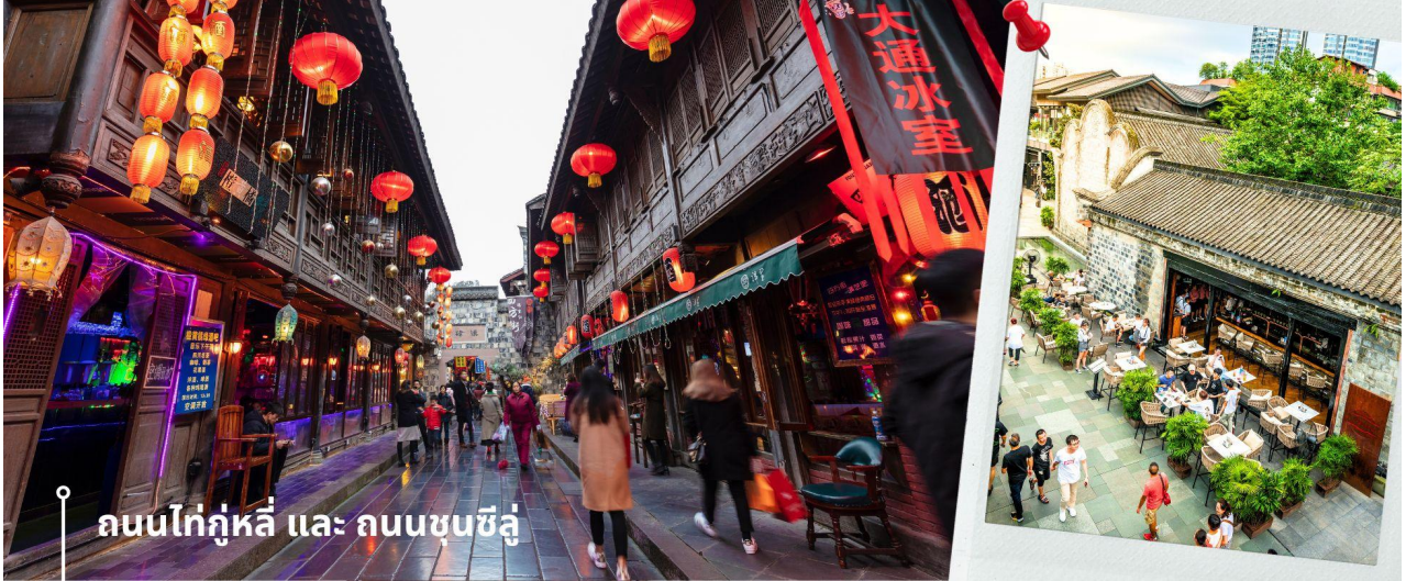
ถนนไท่กุ่หลี่ และ ถนนซุนชู่

จากนั้นให้ท่านให้อิสระกับการเลือกซื้อสินค้าของฝากที่ เล่น ถนนคนเดินไท่กุ่หลี่ แต่เดิมที่ตรงนี้คือบริเวณของวัดต้าฉือที่พระถังซำจั๋ง เคยจำพรรษาก่อนเดินทางไปชมพูทวีป โดยทางโครงการได้อนุรักษ์อาคารบางส่วนและปรับปรุงพื้นที่รอบๆ ขึ้นโดยมีวัดเป็นศูนย์กลาง ปัจจุบันเป็นแหล่งช้อปปิ้ง สถานบันเทิง และไลฟ์สไตล์ยอดนิยมใจกลางเมืองเฉิงตู มณฑลเสฉวน ประเทศจีน ขึ้นชื่อเรื่องบรรยากาศที่ทันสมัย โดดเด่นด้วยสถาปัตยกรรมแบบผสมผสานระหว่างตะวันออกและตะวันตก เพื่อให้นักท่องเที่ยวได้เลือกซื้อตามอิสระ แวะร้าน POP MART