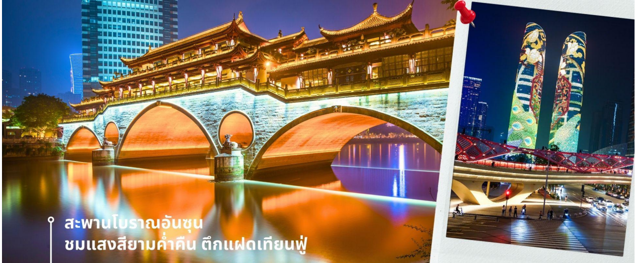
สะพานโบราณอันซุน ชมแสงสียามค่ำคืน ตึกแฝดเทียนฟู

มีหลังคา ตามลักษณะสถาปัตยกรรมจีนโบราณ อายุมากกว่า 300 ปี และในบริเวณใกล้กัน ยังเป็นที่ตั้งของ ตึกแฝดเทียนฟู โดยในช่วงค่ำเวลา ประมาณ 19.00-22.00 น. ทั้ง 2 ตึกจะเป็นไฟ LED สวยงามโดดเด่นมาก ตึกแฝดเทียนฟู หรือที่เรียกอย่างเป็นทางการว่าตึกศูนย์การเงินนานาชาติเทียนฟู เป็นตึกกระจาที่สวยงามโดดเด่นสองตึกในย่านการเงินของเฉิงตู ตึกแต่ละตึกมีความสูง 58 ชั้นและสูงกว่า 700 ฟุต ตึกเหล่านี้โดดเด่นเป็นพิเศษด้วยภายนอกที่หุ้มด้วยไฟ LED ที่เป็นเอกลักษณ์ ซึ่งเปลี่ยนอาคารให้กลายเป็นจอภาพดิจิทัลขนาดใหญ่