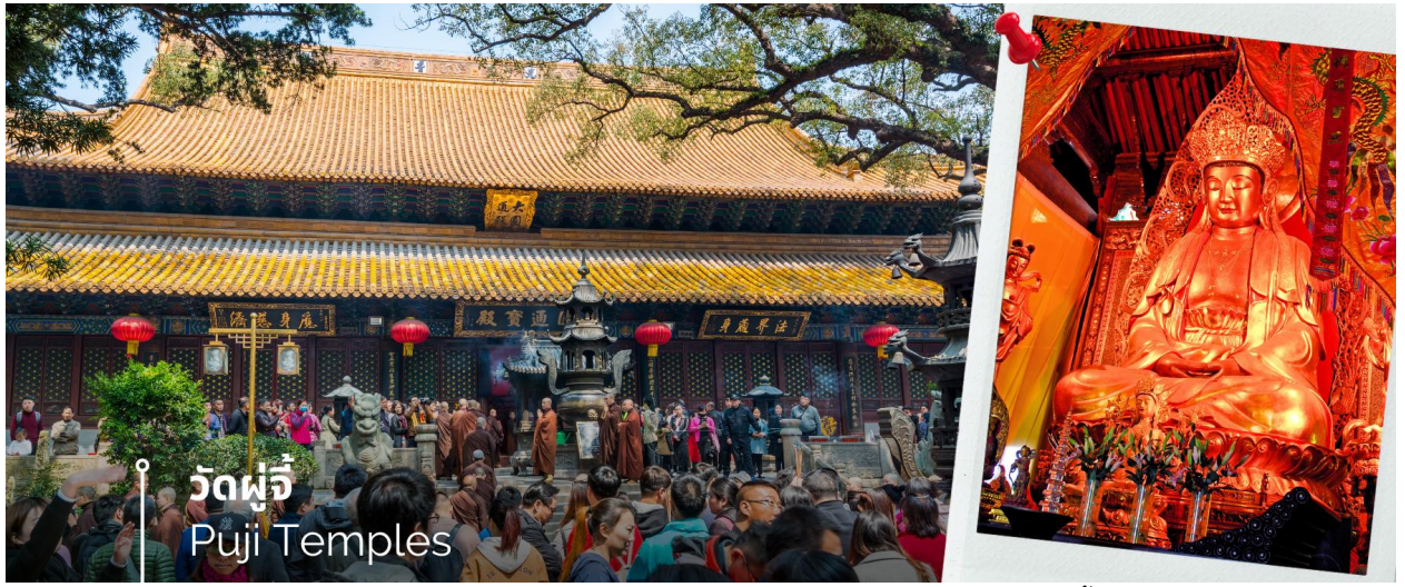
วัดผู้จี Puji Temples

นำท่านสู่ วัดผู้จี วัดในตำนานที่ควรมาเป็นอย่างยิ่ง โดยไฮไลท์ของวัดนี้คือ องค์พระโพธิสัตว์ที่มีเทพลักษณะเป็นชาย เป็นองค์ที่ชาวจีนทั่วโลกให้ความเลื่อมใสศรัทธาสูงสุด ซึ่งวัดผู้จีนี้เอง เป็นวัดใหญ่ที่สุดบนเกาะที่มีประวัติเก่าแก่นับพันปี แต่เดิมเคยเป็นวัดเล็ก แต่ผ่านร้อนผ่านหนาวมา ตั้งแต่ยุคราชวงศ์ซ่ง หยวน หมิง และชิง จนกระทั่งได้รับพระราชทานนาม “ผู้จี” จากจักรพรรดิคังซีแห่งราชวงศ์ชิง ส่วนในรัชสมัยของจักรพรรดิหย่งเจิ้นก็ได้รับการบูรณะครั้งใหญ่จนกลายเป็นวัดที่มีขนาดใหญ่และสำคัญที่สุดบนเกาะ ภายในมีพื้นที่กว้างขวาง มีสถาปัตยกรรมวิจิตรงดงามมากมาย