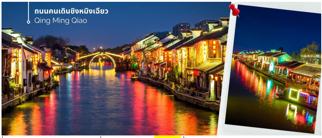
ถนนคนเดินชิงหมิงเจียว Qing Ming Qiao

ค่ำ รับประทานอาหารค่ำ ณ ภัตตาคาร (10) เมนูพิเศษ ซีโครงหมูอูซี พักที่ (อูซี) Wyndham Garden Wuxi Huishan HOTEL หรือเทียบเท่า ระดับ 5ดาว วันที่ห้า พระใหญ่หลิงซาน(รวมรถราง+ศาลาผานกง)-หมู่บ้านโบราณจูเจียเจียว+ล่องเรือ -กลับเซี่ยงไฮ้