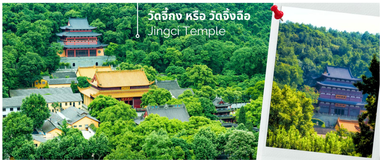
วัดจี้กง หรือ วัดจี้ฉือ Jingci Temple

จากนั้นนำท่าน เที่ยวยาม วัดจี้กง หรือ วัด Jingci หรือวัดจี้ฉือ ตั้งอยู่บนฝั่งตะวันตก ตรงข้ามกับเจดีย์ Leifeng วัดจี้ฉือเป็นหนึ่งในสี่วัดโบราณในประวัติศาสตร์ของทะเลสาบตะวันตก และเป็นหนึ่งในวัดที่เป็นวัดพุทธที่โดดเด่นมีชื่อเสียงอย่างมากของจีน