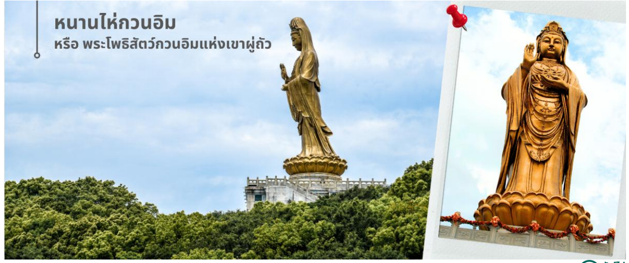
หนานไห่กวนอิม หรือ พระโพธิสัตว์กวนอิมแห่งเขาผู้ถั่ว

จากนั้นนำท่านกราบขอพรพระโพธิสัตว์กวนอิม หนานไห่กวนอิม หรือ พระโพธิสัตว์กวนอิมแห่งเขาผู้ถั่ว องค์ใหญ่และงดงามที่สุดในเกาะ สูงถึง 28 เมตร ซึ่งประดิษฐานอยู่ที่ตำหนักริมทะเล หรือ หนานไห่กวนอิม เป็นประติมากรรมแบบจีนรูปพระโพธิสัตว์กวนอิม ซึ่งเป็นจุดหมายตาสำคัญของเขาผู้ถั่ว เมืองโจวซาน ทางตอนตะวันออกของมณฑลเจ้อเจียง ประเทศจีน ประติมากรรมสูง 33 เมตร และหนัก 70 ตัน ได้รับทุนและก่อสร้างโดยผู้ศรัทธาชาวจีนทั้งในและต่างประเทศ อันเป็นสถานที่ศักดิ์สิทธิ์ที่ชาวผู้โลวซาน ให้ความเคารพนับถือมายาวนานกว่า 2,000 ปี