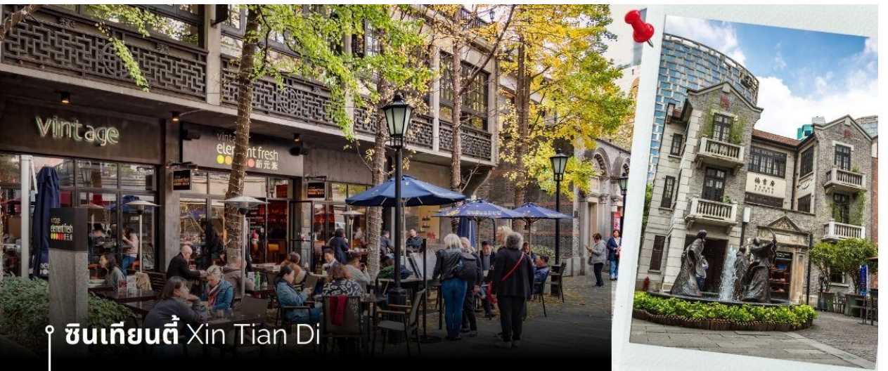
ซินเทียนตี้ Xin Tian Di

เที่ยง ๑๑ รับประทานอาหารกลางวันที่พักัดตาคาร (15) หลังจากนั้น เซคอินสตูดิโอ ที่ 13DE MARZO หมี่เกาะแก้ว ทุกแก้วที่นำเสิร์ฟเครื่องต้ม จะแถมพื้หมี่ตัวจิ๋วน่ารัก ส่งมอบให้ทุกท่าน (แถมฟรี เครื่องต้ม ท่านละ 1แก้ว) นำท่านเที่ยวชม ซินเทียนตี้ ย่านฮิปเตอร์ใจกลางนครเซี่ยงไฮ้ ที่วัยรุ่นต้องมา กลายเป็นสถานที่ท่องเที่ยวติดอันดับต้นๆไปแล้ว สำหรับแหล่งช้อปปิ้งแห่งนี้ ไม่แพ้แหล่งช้อปปิ้งรุ่นพี่ อย่าง ถนนนานกิง ถนนอู๋เจียง Yu Yuan Bazaar ถือว่าเป็นอีก 1 ไฮไลท์เด็ดของนครแห่งนี้ เนื่องจากเอกลักษณ์ที่ไม่เหมือนใคร สิ่งปลูกสร้างที่ใช้วัสดุลอกแบบสถาปัตยกรรมแบบ Shikumen (ซิกเหมิน) การผสมผสานระหว่างสถาปัตยกรรมตะวันตกกับจีนเข้าด้วยกัน ทางเดินหิน กำแพงหิน ประติมากรรม บ้านเมืองเก่าแต่ดูน่ารักช้ออย่างดี