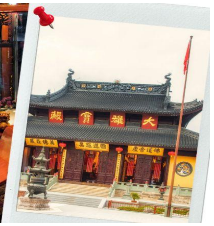
วัดพระหยกขาว Jade Buddha Temple