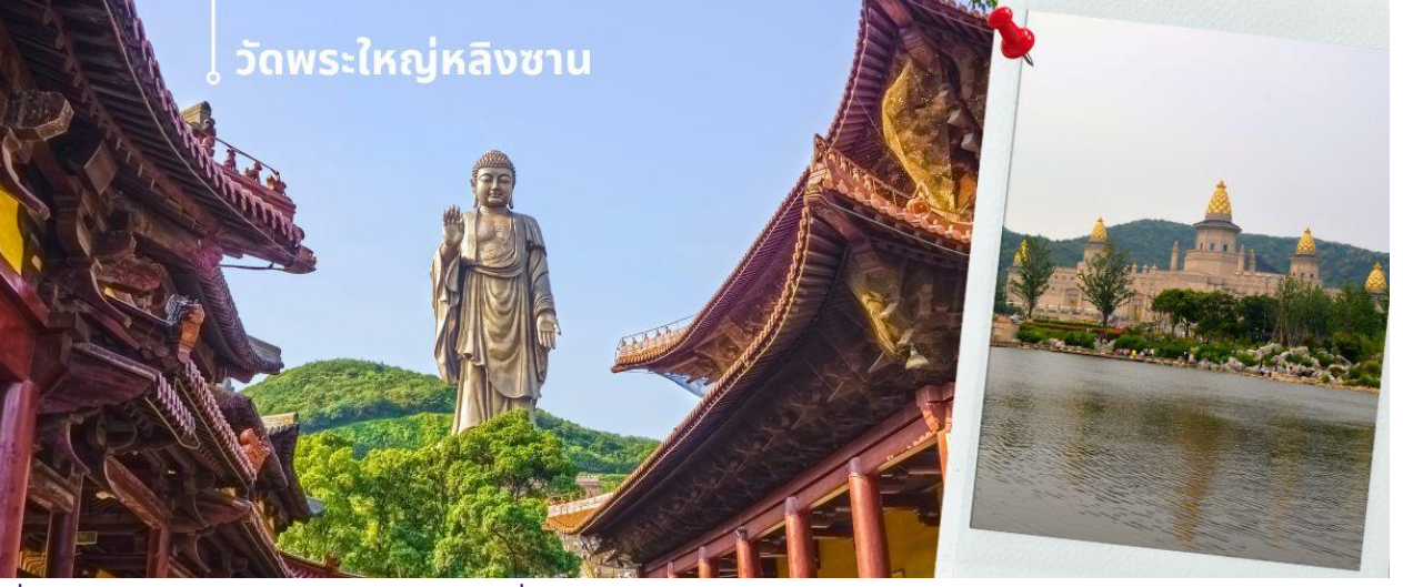
วัดพระใหญ่หลิงซาน

เช้า รับประทานอาหารเช้า ณ ห้องอาหารโรงแรม (11) จากนั้นนำท่านชม วัดพระใหญ่หลิงซาน (นั่งรถราง) ตั้งอยู่ที่เมืองอูซี มณฑลเจียงซู ประเทศจีน สิ่งให้เห็นแบบเด่นชัดเมื่อมาเที่ยวที่วัดนี้คือ “หลิงซานต้าผอ” หรือ “พระใหญ่หลิงซาน” พระพุทธรูปองค์ใหญ่ที่ใหญ่ที่สุดองค์หนึ่งในประเทศจีนและในโลก เป็นพระพุทธรูปปางยืนของพระอมิตาภพุทธะแบบสัมฤทธิ์กลางแจ้ง หนักกว่า 7,000 เมตริกตัน สร้างเสร็จเมื่อปลายปี ค.ศ. 1996 มีความสูงกว่า 88 เมตร (289 ฟุต) รวมฐานบัว 9 เมตร นักท่องเที่ยวทั้งชาวจีนและชาวต่างชาตินิยมมาขอพรเพื่อความสิริมงคลและความสำเร็จในหน้าที่การงาน การเดินทางให้แคล้วคลาดปลอดภัย โดยการกราบและลูบที่เท้าท่าน ซึ่งภายในพระพุทธรูปยังมีพิพิธภัณฑ์ชีวิตประวัติของท่านให้ได้เรียนรู้อีกด้วย ภายในประกอบไปด้วย ตำหนักผานกง หรือ ศาลาผานกง ตั้งอยู่ที่ริมทะเลสาบไท่หู ทางตะวันออกของพุทธอุทยานก่อสร้างราวปี 2006 บนเนื้อที่กว่า 7 หมื่นตารางเมตร เป็นที่รวมของศิลปวัฒนธรรมอันหลากหลายของพุทธศาสนาในแต่ละนิกายและแต่ละประเทศได้อย่างงดงามลงตัว จนถูกเรียกขานว่าเป็น “พิพิธภัณฑ์พุทธศิลป์ร่วมสมัยแห่งประเทศจีน” เพราะเป็นที่รวมของพิพิธภัณฑ์ นิทรรศการ โรงละคร คอนเสิร์ต และงานพุทธศิลป์มากมาย ที่น่าตื่นตาตื่นใจ