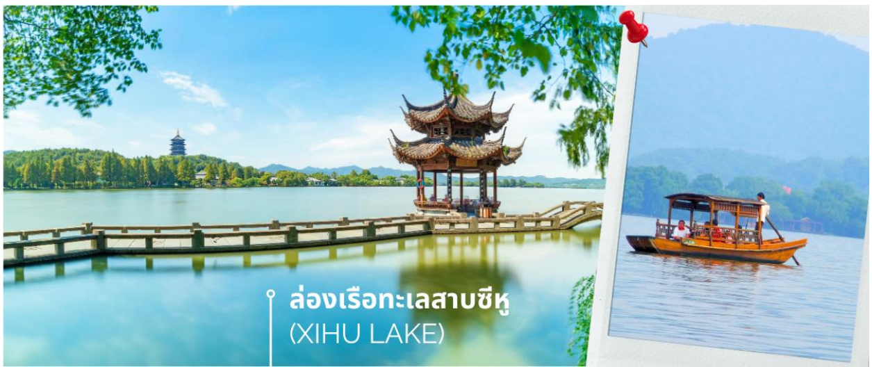
ล่องเรือทะเลสาบซีหู (XIHU LAKE)

จากนั้นนำท่าน เที่ยวยาม วัดจี้กง หรือ วัด Jingci หรือวัดจี้ฉือ ตั้งอยู่บนฝั่งตะวันตก ตรงข้ามกับเจดีย์ Leifeng วัดจี้ฉือเป็นหนึ่งในสี่วัดโบราณในประวัติศาสตร์ของทะเลสาบตะวันตก และเป็นหนึ่งในวัดที่เป็นวัดพุทธที่โดดเด่นมีชื่อเสียงอย่างมากของจีน