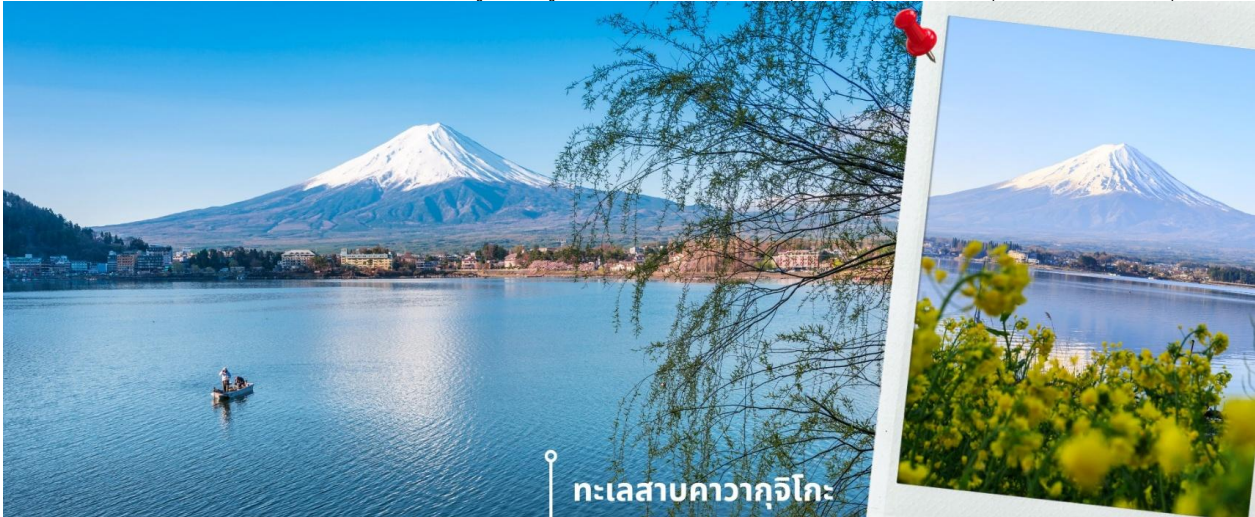
ทะเลสาบคาวากุจิโกะ

เช้า รับประทานอาหารเช้าที่ โรงแรม (4) หลังรับประทานอาหารเช้า นำท่านแวะชม พิพิธภณช์แผ่นดินไหว เป็นพิพิธภณช์ที่แสดงถึงผลกระทบจากภัยพิบัติแผ่นดินไหวและการระเบิดของภูเขาไฟ ภายในพิพิธภณช์มีห้องจัดแสดงข้อมูลการประทุของภูเขาไฟจากทุกมุมโลก โชว์ความรู้ต่างๆและโชว์ข้อป้ังสินค้าญี่ปุ่นอาทิเช่น ผลิตภัณฑ์เครื่องสำอางและของฝากอีกมากมาย พอสมควรแก่เวลานำท่านเดินทางสู่ ทะเลสาบคาวากุจิโกะ (Lake Kawaguchiko) ในจังหวัดยามานาชิ แหล่งท่องเที่ยวที่อยู่ไม่ไกลจากโตเกียว (Tokyo) หนึ่งในที่ที่วิวญี่ปุ่นยอดฮิตตลอดกาล ทะเลสาบที่กว้างใหญ่เป็นอันดับ 2 ของ 5 ทะเลสาบรอบภูเขาไฟฟูจิ อยู่บริเวณเชิงภูเขาไฟ ความสูงกว่าระดับน้ำทะเลประมาณ 800 เมตร ทำให้สภาพอากาศบริเวณนี้เย็นสบายตลอดปี รายล้อมไปด้วยธรรมชาติที่อุดมสมบูรณ์ และวิวทิวทัศน์สวยงามตลอดปี ในช่วงเวลาที่พลาดไม่ได้เลยที่จะได้ชื่นชมดอกซากุระบาน คือในช่วงปลายเดือนมีนาคมจนถึงต้นเดือนเมษายน จะบานสะพรั่งสวยงามเรียงรายริมทะเลสาบสามารถชมวิวได้ทั้งทะเลสาบและภูเขาไฟฟูจิได้อย่างชัดเจน นับเป็นจุดชมซากุระยอดฮิตที่สุดอีกแห่งหนึ่งในญี่ปุ่น