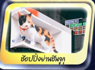
ช้อปปังฟานชินจุกุ

ต้นตาดั้นใจกับท่าแพงหิมะ บนเทือกเขาจแปนแอลป์ เช็คอินที่หมู่บ้านชิราคาวาโกะ ชมงานประดับไฟนาบานะ โนะ ซาโตะ ขึ้นภูเขาไฟฟูจิชั้นที่ 5 สวนโออิชิปาร์ค เยือนปราสาทโอซาก้า วัดทองคินคะคุจิ ช้อปปังฟานชินจุกุ