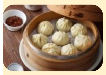
เที่ยง บริการอาหารกลางวัน ณ ภัตตาคาร เมนูพิเศษ!! เสียวหลงเปา (6)