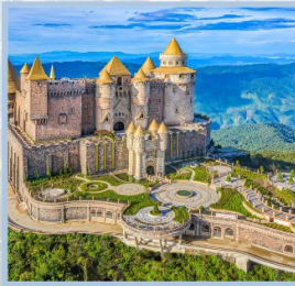
ปราสาทจันทร