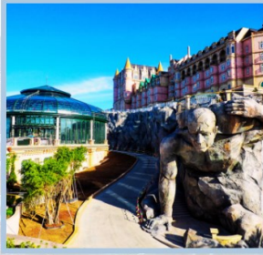
โซน Eclipse Square