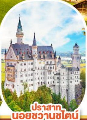
ปราสาท นอยชวานชไตน์