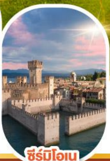
ซิร์มีโอน

เดินทาง 04-10 มี.ค. 68 28 เม.ย. - 04 พ.ค. 68 30 พ.ค. - 05 มิ.ย. 68 11-17 มิ.ย. 68