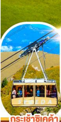
กระเช้าซีเคต้า