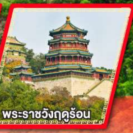
พระราชวังฤดูร้อน

มือพิเศษ.. เปิดปักกิ่ง, สุกี้มองโกล, อาหารกวางตุ้ง