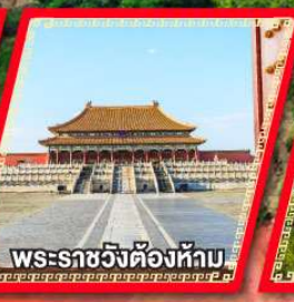
พระราชวังต้องห้าม