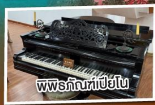
พืชรักบี้เปียโน

พัก 4 ดาว เมนูพิเศษ!!! เปิดปิกกึ่ง อาหารแต่จิว 18 อย่าง