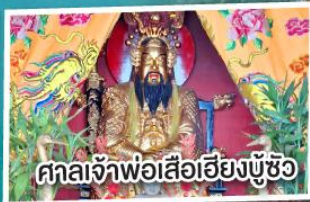
ศาลเจ้าพ่อเสือเฮียงบู๊ซิว