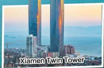
Xiamen Twin Tower