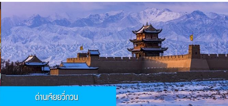
ด่านเจียวกวน