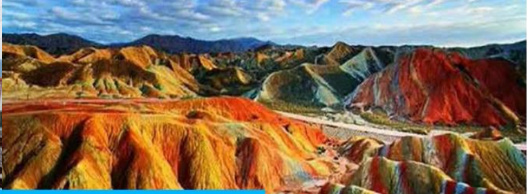
อุทยานธรณีวิทยาต้นเสี้ยวเจีย