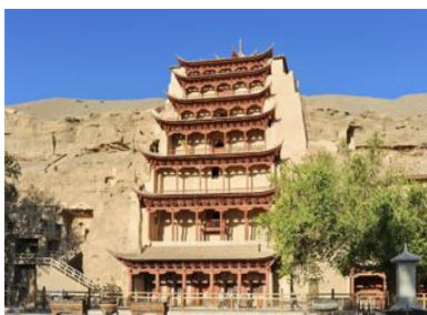
ถ้ำหินเบ้ากาอู

พักที่ REZEN HOTEL ระดับ 4 ดาวท้องถิ่นหรือเทียบเท่าในเมือง เจียวกวน