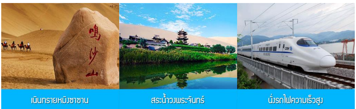
เดินทรายหมีขาซาฮาน สระน้ำวังพระจันทร์ มุ่งรถไฟความเร็วสูง

ค่ำ รับประทานอาหารค่ำ ณ ภัตตาคาร พักที่ METRO PARK HOTEL โรงแรมระดับ 4 ดาวท้องถิ่นหรือเทียบเท่าในเมืองตุนหวง หลังอาหารให้ท่าน มีเวลาเดินเล่น ช้อปปิ้งใน ตลาดกลางคืน ซาโจว 沙洲夜市 ให้ท่านเลือกซื้อของที่ระลึกของเส้นทางสายไหมได้ตามอัธยาศัย