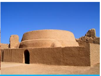
เมืองโบราณเกาซางกู๋เจิง