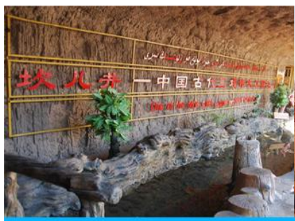
ระบบชลประทานกู๋หลู่ฟาน

พักที่ HAMPTON BY HILTON HOTEL โรงแรมระดับ 4 ดาวหรือเทียบเท่าในเมืองกู๋หลู่ฟาน