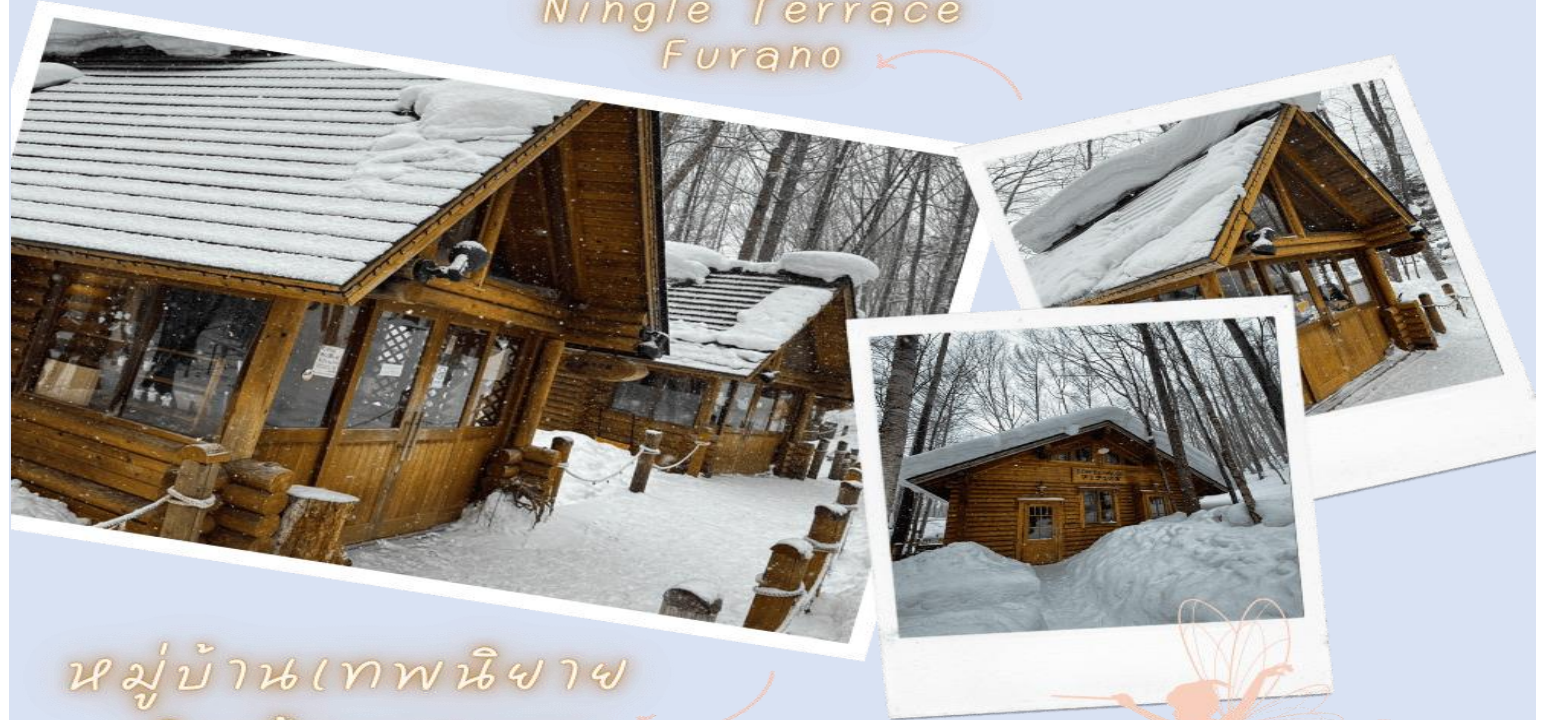
หมู่บ้านเทพนิยาย หนึ่งแก้วเทอเรส