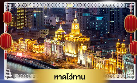
หาดงอทาน