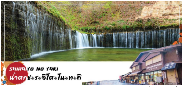
SHIRAITO NO TAKI น้ำตกชิราอิโตะในะตะกิ

น้ำตกชิราอิโตะถือเป็นน้ำตกที่ศักดิ์สิทธิ์ มีศาลเจ้าอาซามะตั้งอยู่ ด้วยการไหลของสายน้ำที่แยกสายออกเป็นหลากรอยเส้น ทำให้มองดูแล้วเหมือนกับเส้นด้ายสีขาว จึงเป็นที่มาของชื่อเรียกที่ว่า ชิราอิโตะ ที่แปลตรงตัวว่า ด้ายสีขาวนั่นเอง อีกทั้งที่นี่ยังมีเรื่องราวของการปฏิบัติธรรม