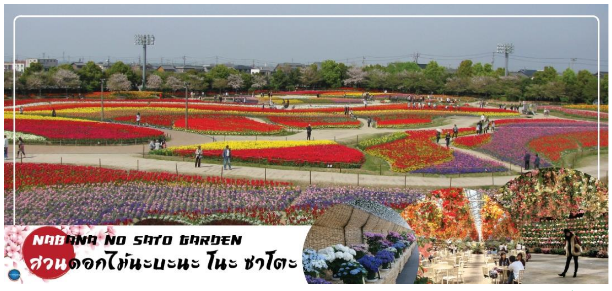
NABANA NO SATO GARDEN สวนดอกไม้ทะเลบะนะ โนะ ซาโตะ

VN008 BKK-SGN-KIX // NRT-SGN-BKK (25 JAN 25)