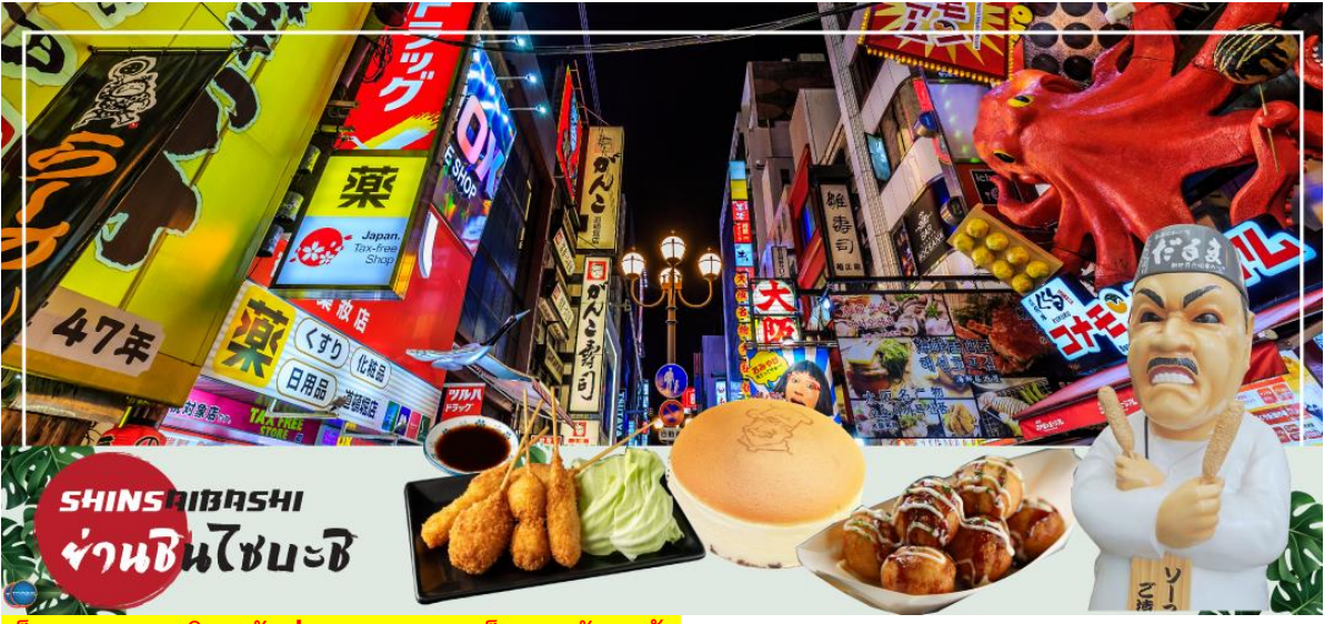
เย็น อิสระรับประทานอาหารเย็นตามอัธยาศัย

จากนั้นอิสระช้อปปิ้ง ย่านชินไซบาชิ (Shinsaibashi) (ใช้ระยะเวลาในการเดินทางประมาณ 30 นาที) บริเวณแหล่งช้อปปิ้งแห่งนี้มีความยาวประมาณ 600 เมตร เต็มไปด้วยร้านค้าปลีก ร้านแฟชั่น ร้านเครื่องสำอางค์ ร้านรองเท้า กระเป๋า นาฬิกา ร้านกาแฟ ร้านอาหาร ร้านขนม ร้านเสื้อผ้าสตรีทแวร์ ร้านทั้งญี่ปุ่นและต่างประเทศ เช่น Zara H&M Beans ABC Mart เป็นต้น เรียกว่ามีทุกอย่างที่ต้องการรวมกันอยู่บริเวณนี้ ใกล้กันท่านสามารถเดินไปยัง ย่านโดทงโบริ (Dotonbori) ย่านบันเทิงยามค่ำ คินดอลอดแนวถนนเลียบบคลองโดทงโบริ จากสะพานโดทงโบริมาชิไปจนถึงสะพานนิปปอนมาชิ ไอไลท์!!! ใครๆ ก็เชิดฉิ่ง ถ่ายภาพคู่ ป้ายกูลิโกะแมน หรือ ป้ายโดทงโบริกูลิโกะ (Dotonbori Glico Sign) เป็นป้ายไฟนีออนรูปนักกรีฑากำลังวิ่งอยู่บนลู่วิ่ง ซึ่งถูกติดตั้งมาตั้งแต่ ปี ค.ศ.1935 นอกจากนี้ยังมีอีกหนึ่งสัญลักษณ์สถานที่ที่นัดพบกันหลง นั่นก็คือ ร้านปูคานิโดรากุ (Kani Doraku) ซึ่งมีปูยักษ์ขยับแขนและลูกตาได้อีกด้วย และห้ามพลาดสำหรับ ทาโกยากิ อาหารท้องถิ่นของชาวโอซาก้า ที่มาถึงถิ่นแล้วต้องลอง Original Taste รับรองไม่ผิดหวังแน่นอน