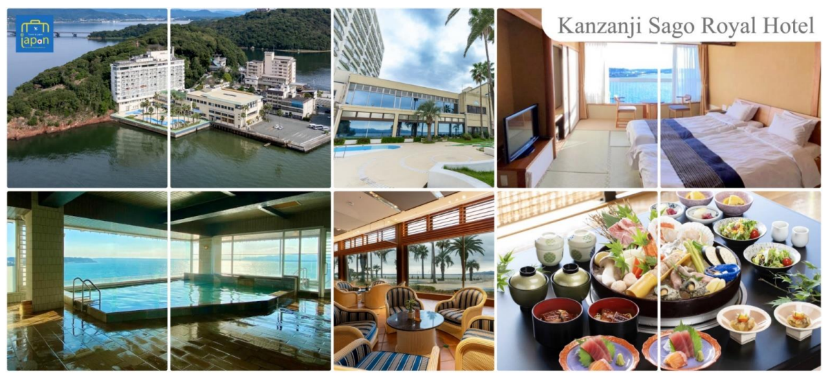
Kanzanji Sago Royal Hotel

จากนั้นให้ท่านได้ผ่อนคลายกับการ แช่น้ำแร่ออนเซ็นธรรมชาติ เชื่อว่าถ้าได้แช่น้ำแร่แล้ว จะทำให้ผิวพรรณสวยงามและช่วยให้ระบบหมุนเวียนโลหิตดีขึ้น