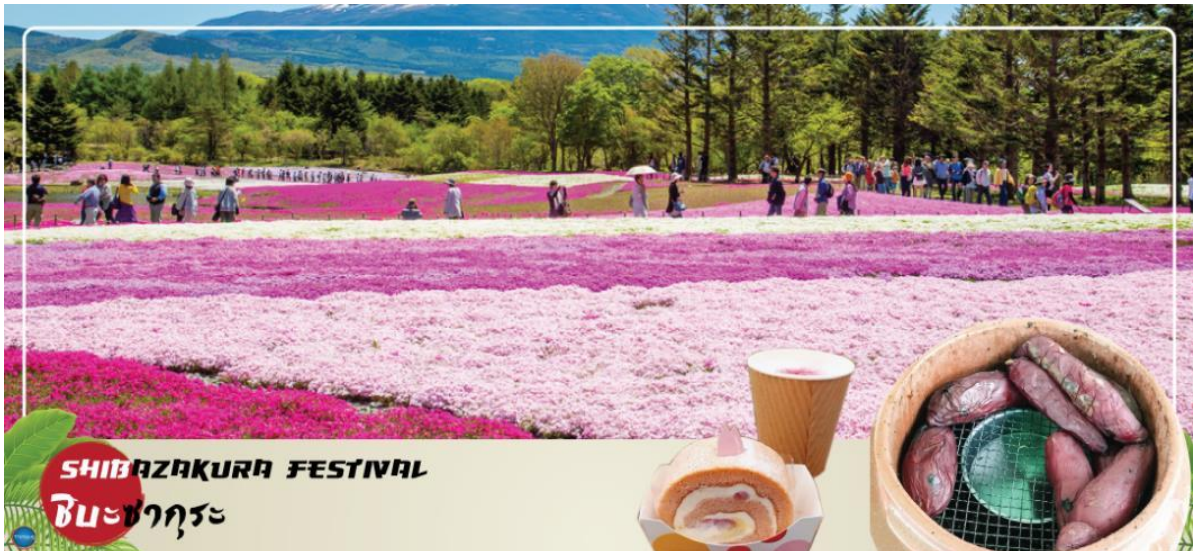
SHIBAZAKURA FESTIVAL ชิบะซากุระ

แหล่งอ้างอิง https://www.fujimotosuko-resort.jp/flower/shibazakura/index.html