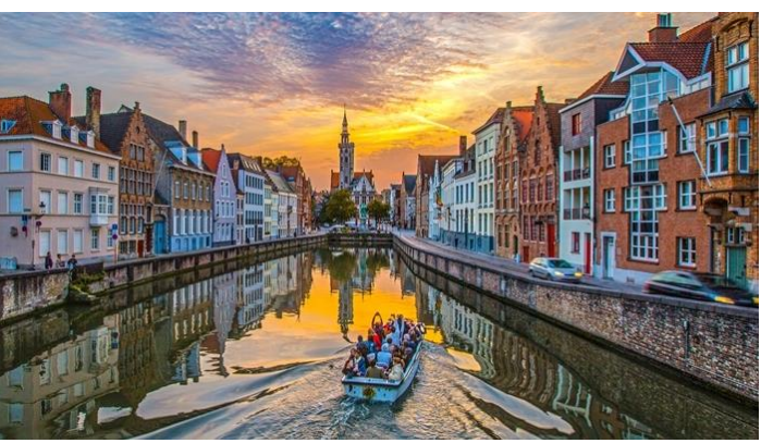
อิสระกับการเดินเล่นที่ตลาดคริสต์มาสกลางเมืองบรูจส์ ซึ่งถือ