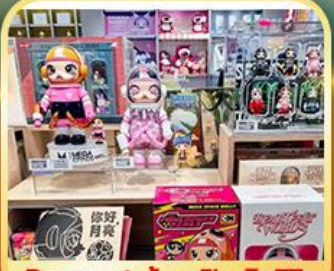
Popmart ห้างหูปิ่น อิน77