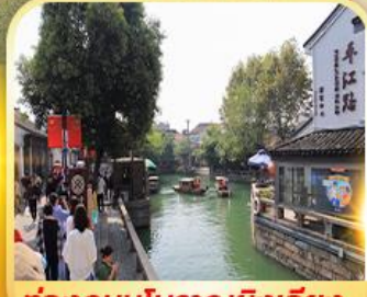
ท่องเที่ยวโบราณผิงเจียง