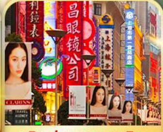
เดินเล่นถนนหนานจิง