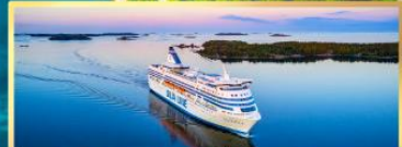
เรือ Tallink Silja Line

เดินทาง 05 - 13, 12-20 เม.ย.68 03 - 11, 10-18 พ.ค.68 04 - 12, 11-19, 18-26 ต.ค.68