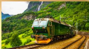
รถไฟสายฟลิมส์บาน่า