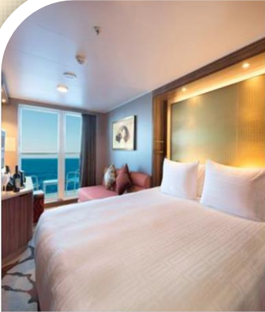
Oceanview Stateroom with Balcony