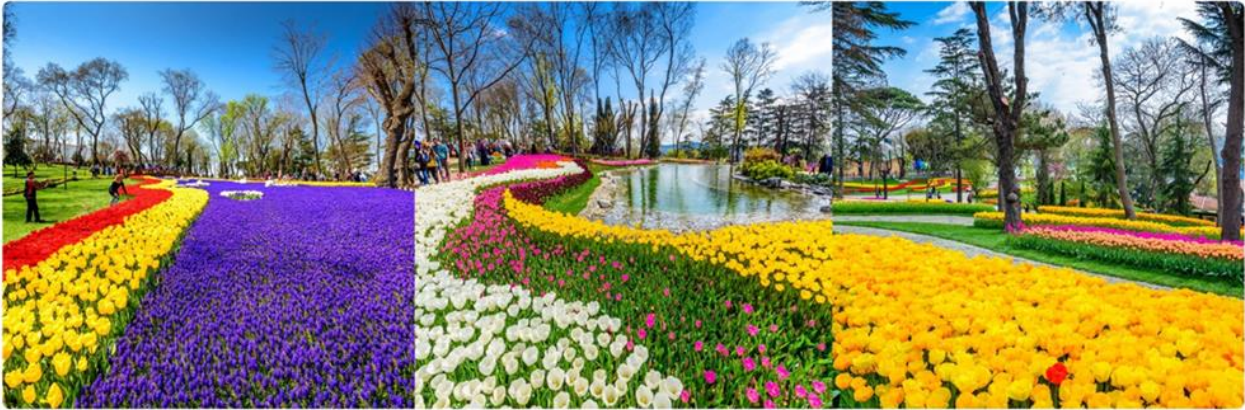
(สวนดอกทิวลิปมีเฉพาะที่เรียดเดือนเมษายนเท่านั้น)