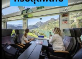
รถไฟ Panarama วิวดูวิว