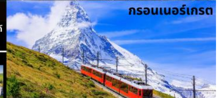
กรอนเนอร์เกรต