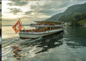
ล่องเรือชมวิวทะเลสาบลูเซิร์น