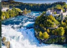
เขื่อนน้ำตกโรน