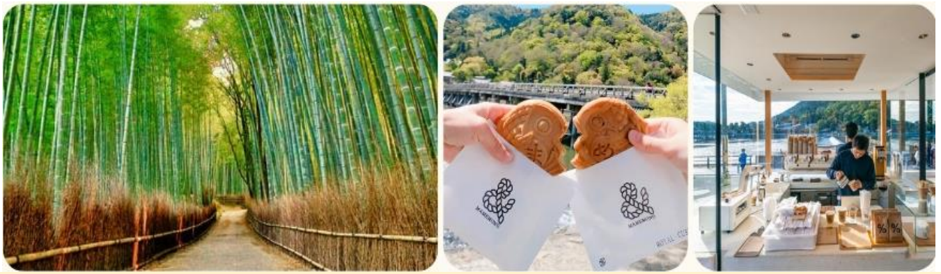
กลางวัน รับประทาน อาหารกลางวัน ณ ร้านอาหารญี่ปุ่น

วัดคินคะคุจิ (Kinkakuji Temple) เป็นวัดสี่เหลี่ยมทองอร่ามตั้งโดดเด่นเป็นสง่า และที่สำคัญวัดคินคะคุจิ ก็ไปปรากฏอยู่ในการ์ตูนเรื่อง เณรน้อยเจ้าปัญญา “อิคคิวซัง” หรือมีอีกชื่อก็คือ วัดทอง (Golden Pavilion) และมีชื่อที่เป็นทางการคือ วัดโรคุออนจิ (Rokuonji Temple) สร้างขึ้นในปี 1397 ตั้งอยู่ในเมืองเกียวโต เป็นวัดพุทธนิกายเซ็น สำนักรินไซ เป็นแหล่งท่องเที่ยวที่นิยมอย่างมากทั้งชาวญี่ปุ่นเองและชาวต่างชาติ