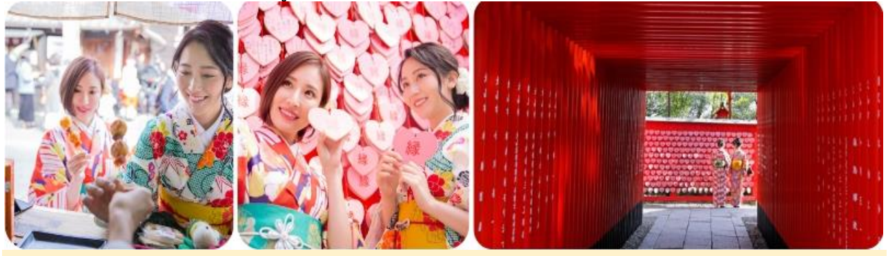
กลางวัน รับประทานอาหารกลางวัน ณ ร้านอาหารญี่ปุ่น

เดินเล่น ย่านอินุยามะ โจกะมาจิ เต็มไปด้วยบ้านเรือนไม้ ก่อแก่ที่เปิดเป็นร้านค้า ร้านอาหาร คาเฟ่ ร้านขายของที่ระลึกต่าง ๆ มีของกินขึ้นชื่อของเมือ อินุยามะให้ได้ลิ้มลอง อย่างเช่น เต้าหู้ย่างทาซอสมิโซะเสียบไม้ที่เรียกว่าเต็งงากุ (Dengaku) Koi Komachi Dango ที่ฮิตกันมากในโลกโซเชียล จากนั้นพอหลังจากเพลิดเพลินไปกับย่านโจกะมาจิแล้วก็ ลองแวะไปศาลเจ้าประจำเมืองที่ศาลเจ้าซังโกะอินาริ (Sanko Inari Shrine) ใครมาขอพรก็จะได้สมหวังในชีวิตคู่