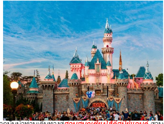
จากถนนนาทานเดนทางสู่สวนสนุกเชียงไฮ้ดิสนีย์แลนด์ สวนสนุก

แห่งที่ 6 แห่งอาณาจักรดิสนีย์ซึ่งมีขนาดใหญ่อันดับ 2 ของโลกรองจากดิสนีย์แลนด์ในออร์แลนโด รัฐฟลอริดา สหรัฐอเมริกา และเป็นสวนสนุกดิสนีย์แลนด์แห่งที่ 3 ในเอเชีย ตั้งอยู่ในเขตฉวนซาใกล้กับแม่น้ำหวงผู่และสนามบินผู้ตง สวนสนุกเชียงไฮ้ดิสนีย์แลนด์มีขนาดใหญ่กว่าฮ่องกง