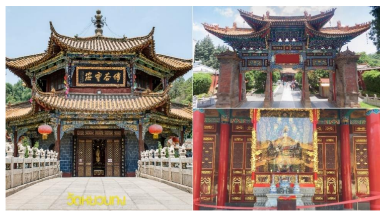
เทศกาลชมดอกไม้ (เดือน ก.พ. - มี.ค. 2568 )

จากนั้นนำสู่ร้านสินค้าพื้นเมืองบัวหิมะ จากนั้นท่านสู่ วัดหยวนทง เป็นวัดที่ใหญ่และเก่าแก่ที่สุดของมณฑลยูนนาน ภายในวัดตกแต่งร่มรื่นสวยงาม กลางลานมีสระน้ำขนาดใหญ่ สร้างมาตั้งแต่สมัยราชวงศ์ถังมีอายุยาวนานประมาณ 1,200 กว่าปี แต่การสร้างวัดแห่งนี้ดูแล้วจะแปลกกว่าวัดอื่นๆในจีน เพราะปกติแล้วการสร้างวัดของจีนส่วนมากจะต้องสร้างอยู่บนภูเขา มีแต่วัดหยวนทงที่สร้างแปลกที่สุดในจีนคือสร้างวัดต่ำกว่าภูเขาโดยวิหารจะอยู่ต่ำที่สุดเนื่องจากวัดแห่งนี้ไม่ได้สร้างขึ้นเพื่อเป็นวัดโดยตรงแต่เคยเป็นศาลเจ้าแม่กวนอิมมาก่อน ดังนั้นคำว่า "หยวนทง" จึงเป็นชื่อที่ปรากฏในคัมภีร์ของ เจ้าแม่กวนอิม