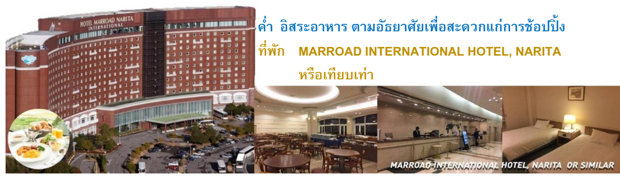
ค่า อีสาระอาหาร ตามอัยยาศัยเพื่อสะดวกแก่การช้อปปิ้ง ที่พัก MARROAD INTERNATIONAL HOTEL, NARITA หรือเทียบเท่า

นำท่านเดินทางสู่ อียอน นาริตะ มอลล์ (AEON NARITA MALL) เป็นห้างสรรพสินค้าที่นิยมในหมู่นักท่องเที่ยวชาวต่างชาติ เนื่องจากตั้งอยู่ใกล้กับสนามบินนานาชาตินาริตะ ภายในตกแต่งในรูปแบบที่ทันสมัยสไตล์ญี่ปุ่น มีร้านค้าที่หลากหลายนานกว่า 150 ร้านจำหน่ายสินค้าแฟชั่น อาหารสดใหม่ และอุปกรณ์ภายในบ้าน นอกจากนี้ยังมีร้านเสื้อผ้าแฟชั่นมากมาย เช่น MUJI , 100 YEN SHOP , SANRIO STORE , CAPCOM GAMES ARCADE และซูเปอร์มาร์เก็ตขนาดใหญ่ เป็นต้น ซึ่งบางร้านไม่ต้องเสียภาษีสินค้าสำหรับนักท่องเที่ยวต่างชาติ ส่วนร้านอาหารก็มีให้เลือกมากมายจำหน่ายอาหารหลายประเภท ร้านกาแฟ และศูนย์อาหาร ถัดไปจากห้างสรรพสินค้ายังมีโรงภาพยนตร์ HUMAX CINEMA เปิดให้บริการ