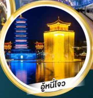
อู่หนี่โจว