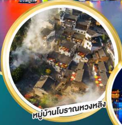
หมู่บ้านโบราณหวงหลิง