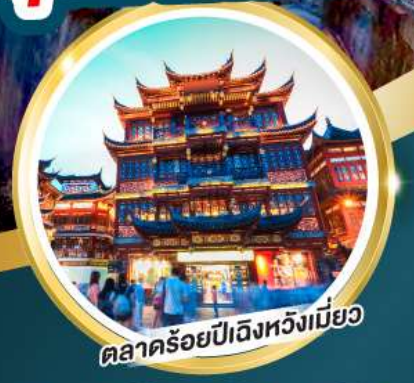
ตลาดร้อยปีเฉิงหวงเหมียว