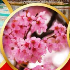
ดอกชาคุระ