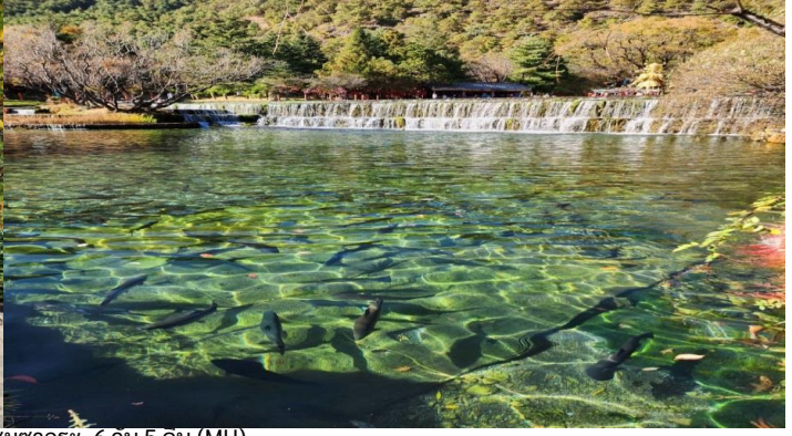
GO1CNXKMG-MU009 เชียงใหม่ คุณหมิง ดาลี ลีเจียง แขงกรลา ชมชาคุระ 6 วัน 5 คน (MU)