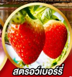
สตรอว์เบอร์รี่