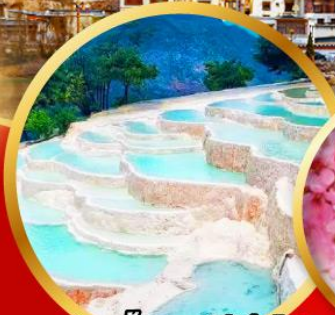
ธารน้ำทว (โป้สุ่ยโก)