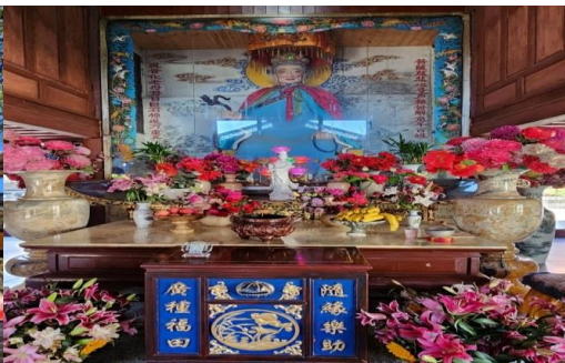
021166395-0853642449 ช่องแคบ หุ่นทองคำ หลี่เจียง แขงกรีลา ชมภูเขา 0 วัน 5 คืน (ฟรี)