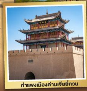
กำแพงเมืองด่านเจียหยี่กวน