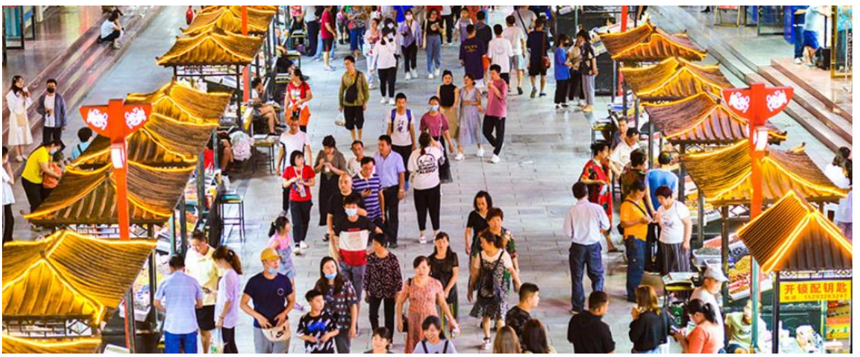
สมควรแก่เวลานำท่านเข้าสู่ที่พัก

คำ รับประทานอาหารค่ำ ณ ภัตตาคาร (เมื่อที่ 11) เมนู หม้อไฟบุฟเฟต์ จากนั้นนำท่านเดินทางกลับสู่ เมือง둔หวง นั้นนำท่านอิสระช้อปปิ้ง ณ ตลาดกลางคืนซาโจว หนึ่งในตลาด ที่ใหญ่และครึกครื้นที่สุดของแถบเอเชีย จากทำเลของเมือง둔หวงที่เสมือนเข้าล้อมรวมอารยธรรมทั้งจาก ตะวันตกและตะวันออก เลือกทานอาหารจากนานาประเทศ ไม่ว่าจะเป็น อาหารชาวยุโรป อูยกูร์ มองโกล ทิเบต คาซัค คีร์กีซ และอีกมากมายให้เลือกชิมเลือกทานกันอย่างจุใจ