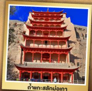
กำแพงสีกม่อเกา