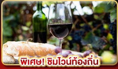
พิเศษ! ซิมไวน์ท้องถิ่น

62,999.- ราคาเริ่มต้น เดินทาง : 02-09 เม.ย. | 10-17 พ.ค. | 22-29 พ.ค. 68