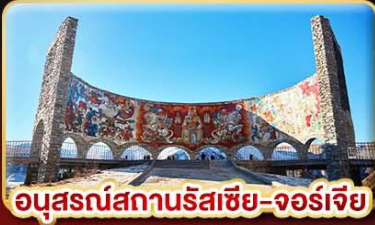
อนุสรณ์สถานรัสเซีย-จอร์เจีย