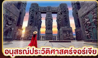
อนุสรณ์ประวัติศาสตร์จอร์เจีย