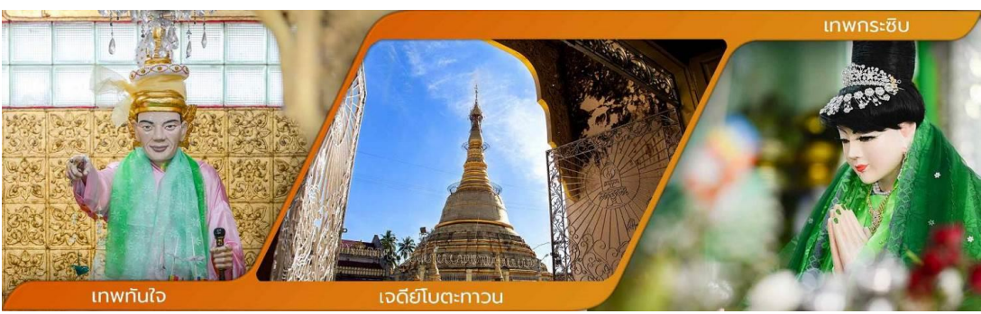
เทพทันใจ

วิธีการสักการะรูปปั้นเทพทันใจ (นัตโบโบยี) เพื่อขอสิ่งใดแล้วสมตามความปรารถนาก็ให้เอาดอกไม้ ผลไม้ โดยเฉพาะมะพร้าวอ่อน กล้วย จากนั้นก็ให้เอาเงินจะเป็นดอลลาร์ บาท หรือจ๊าด ก็ได้ แล้วเอาไปใส่มือของนัตโบโบยี 2 ใบ ไหว้ขอพรแล้วดื่อกลับมา 1 ใบ เอามาเก็บรักษาไว้ จากนั้นก็เอาหน้าผากไปแตะกับนิ้วชี้ของนัตโบโบยี แค่นี้ท่านก็จะสมตามความปรารถนาที่ตั้งใจไว้ คำบูชาเทพทันใจ เอหิ สักกะ มหันทโปปะโปะจีโปตะถ่องสิทธิมัตถุ อิทังพะลัง เอตัสสมิงรัตตะนัง พุทฺธัง ธัมมัง สังฆัง เทวานัง ประสิทธิลาโภ ชโยนิจจัง วันทามิสัพพะทา สวาโหม