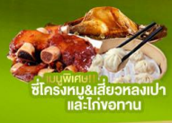
ซีฟงเต๋อ ซิวทงเป่า และไก่ทอด