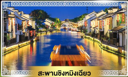
สะพานชิงหมิงเจียว