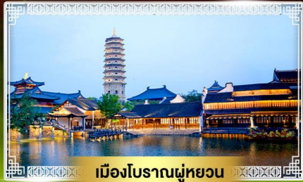
เมืองโบราณฝูหยวน

ล่องเรือทะเลสาบซีหู ไข่มุกแห่งเมืองหางโจว รักการะ "ฉีฉิงซานต้าฝอ"